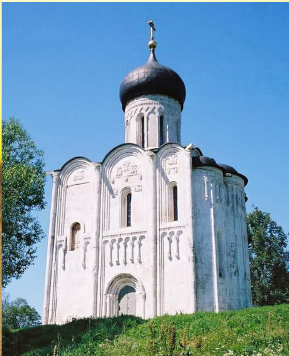
церковь Покрова на Нерли (1165 г.)