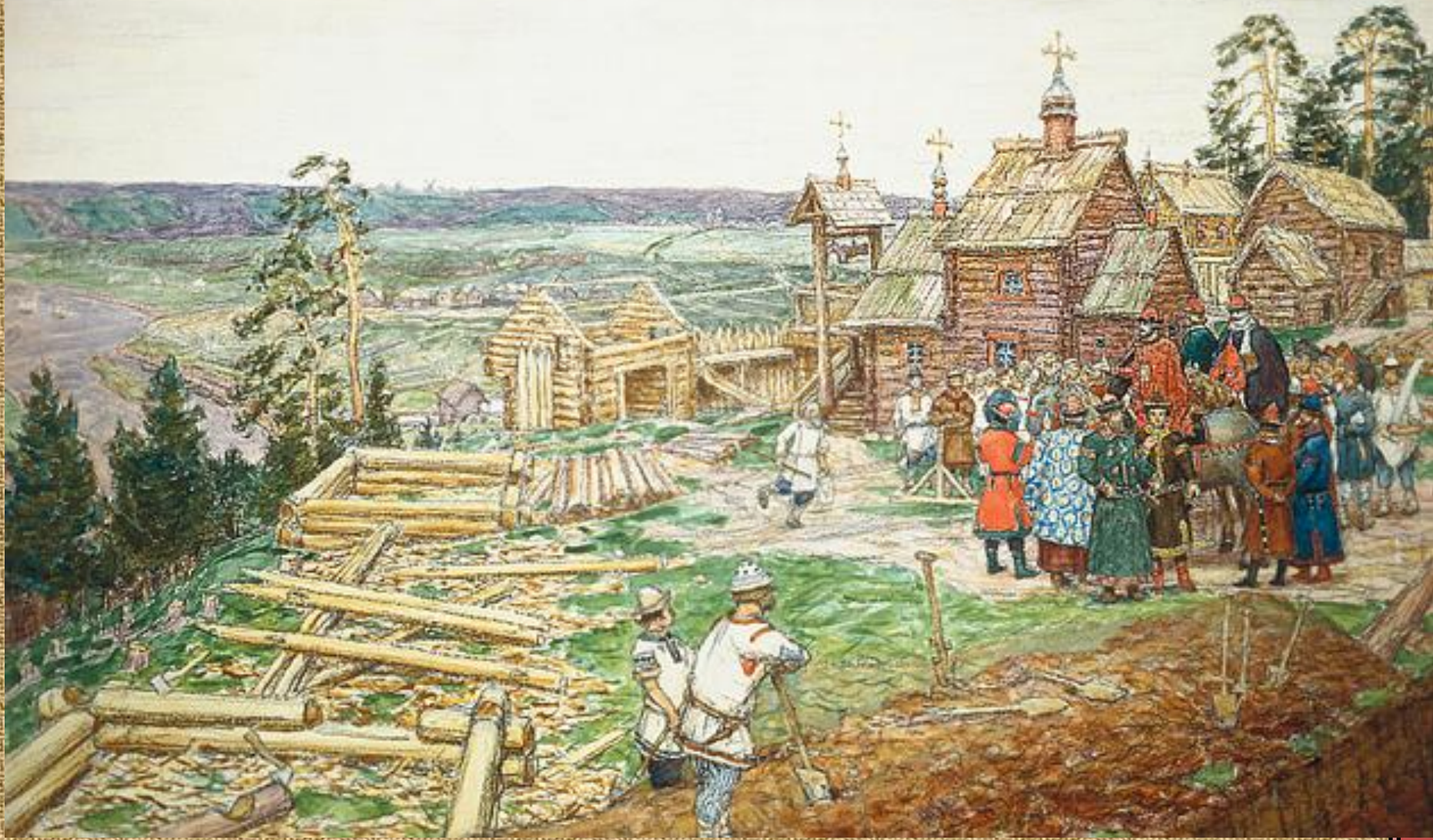
А. М. Васнецов. Основание Москвы. Постройка первых стен Кремля Юрием Долгоруким в 1156 г.