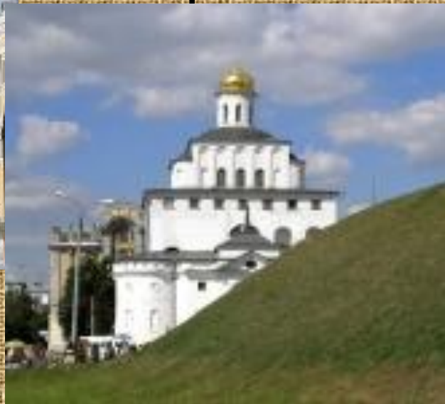
Золотые ворота 1158-64гг.