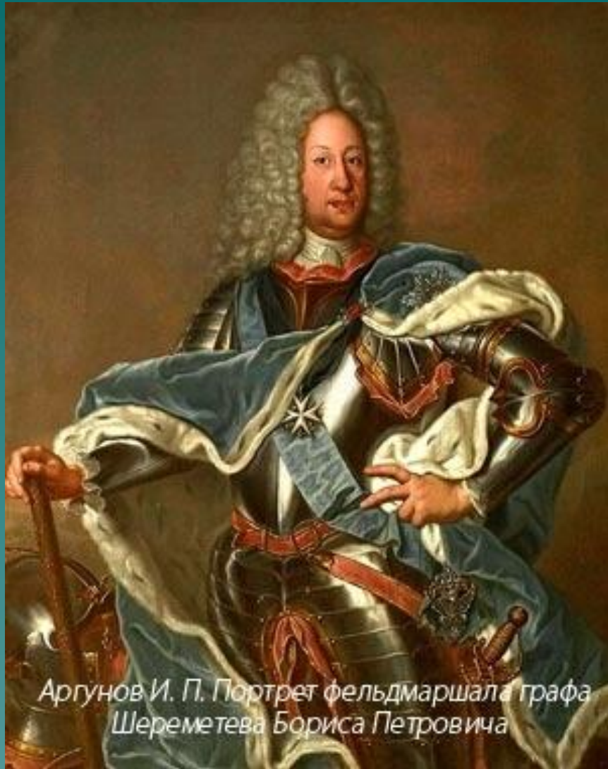
Аргунов И. П. Портрет фельдмаршала графа Шереметева Бориса Петровича