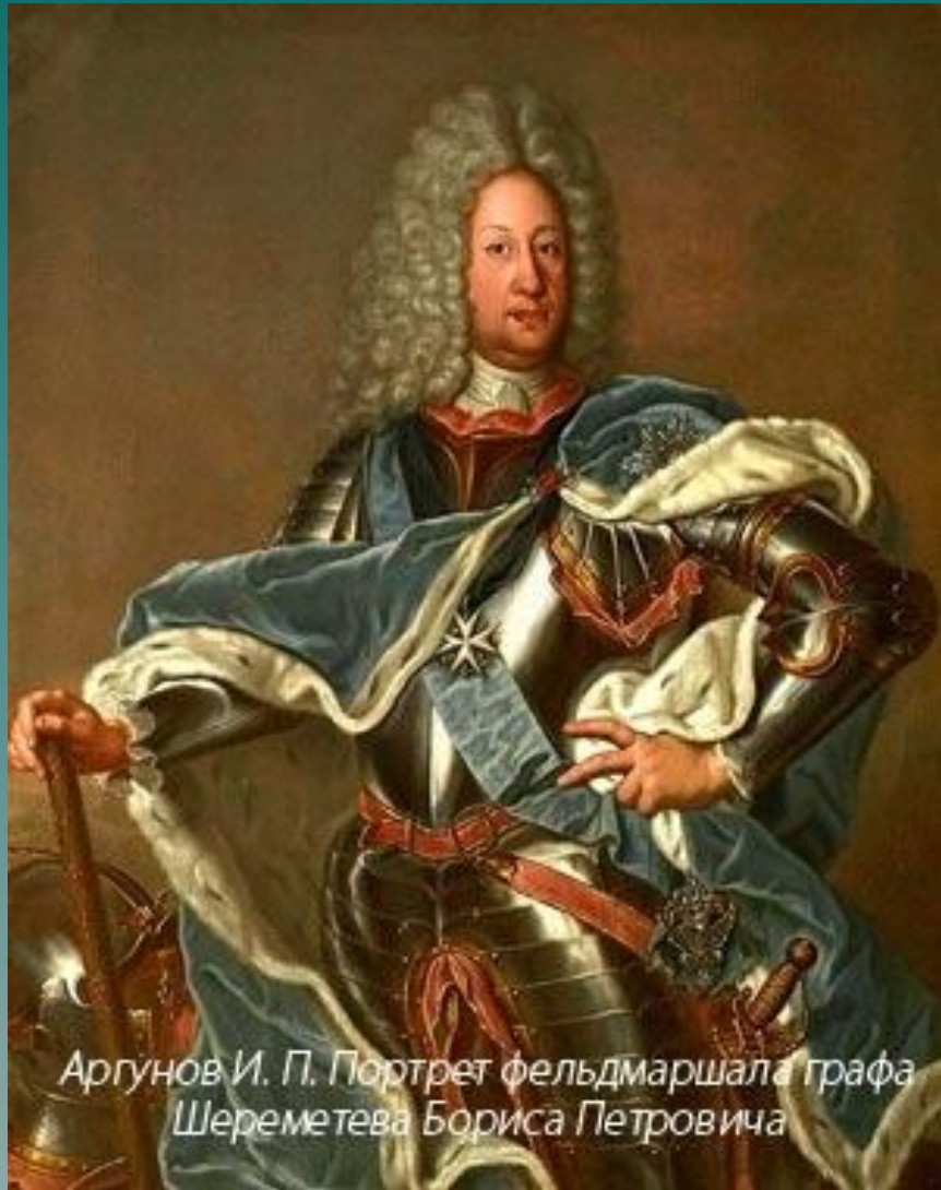
Аргунов И. П. Портрет фельдмаршала графа Шереметева Бориса Петровича