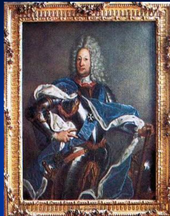
И.Аргунов. Портрет Б.П.Шереметева