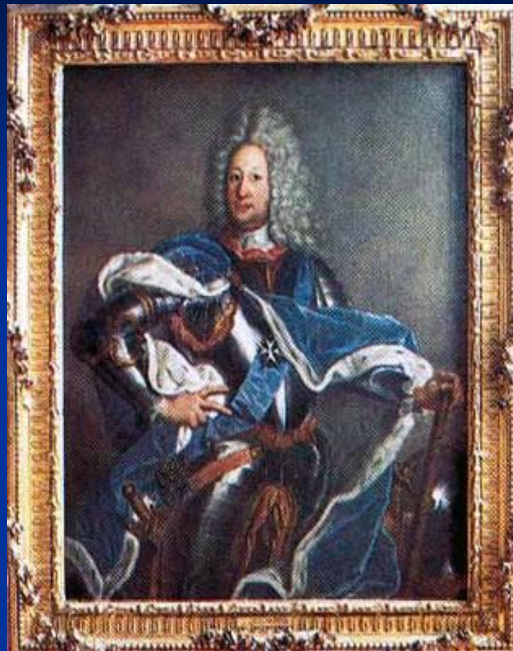
БОРИС ПЕТРОВИЧ ШЕРЕТЕВ. ФЕЛЬДМАРШАЛ. СПОДВИЖНИК ПЕТРА I.