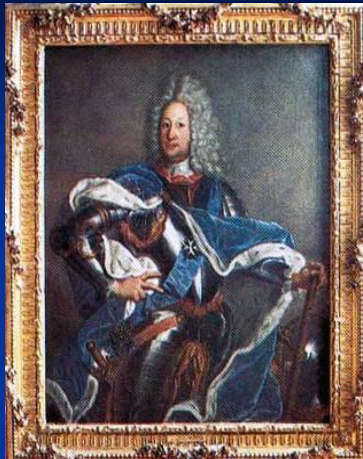
БОРИС ПЕТРОВИЧ ШЕРЕМЕТЕВ. ФЕЛЬДМАРШАЛ. СПОДВИЖНИК ПЕТРА I.

Шереметев стал владельцем усадьбы в 1715 году, купив ее у своего младшего брата Владимира. Заняться устройством имения Борис Петрович не успел, он умер в 1719 году. Усадьба перешла к его сыну и наследнику П.Б. Шереметеву. В 1743 году после женитьбы Петра Борисовича на княжне Варваре Алексеевне Черкасской к Кусково присоединилось соседнее имение Черкасских-Вешняково.