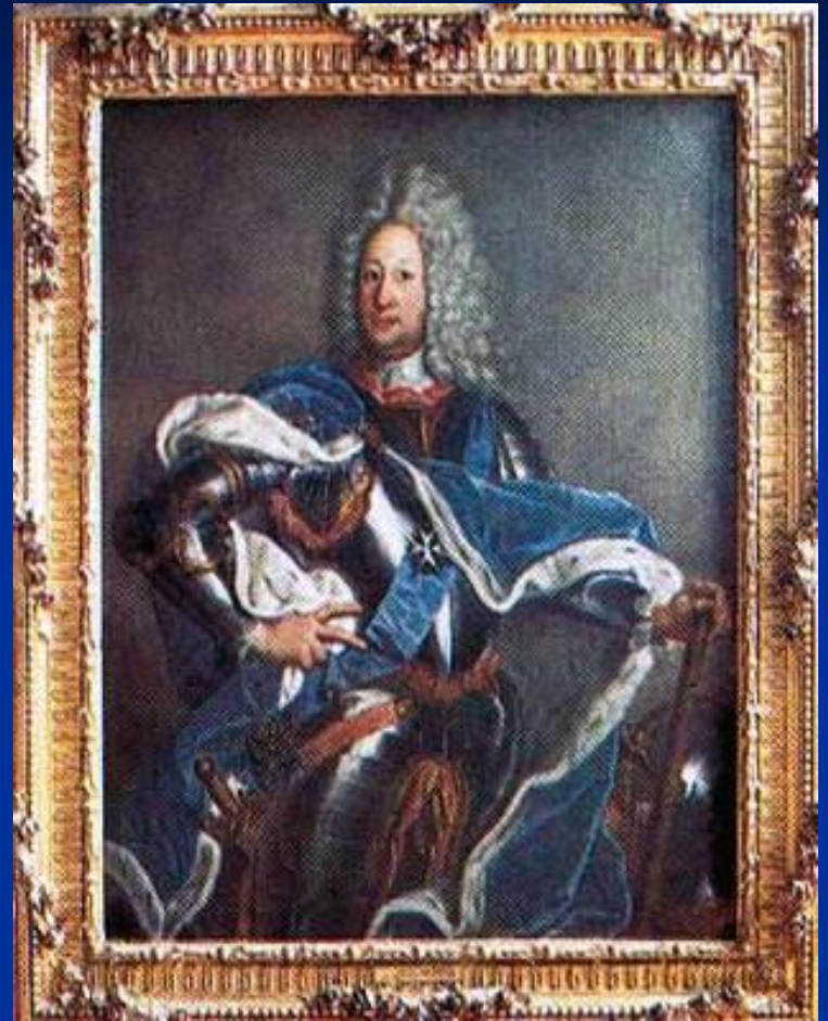
БОРИС ПЕТРОВИЧ ШЕРЕМЕТЕВ. ФЕЛЬДМАРШАЛ. СПОДВИЖНИК ПЕТРА I.