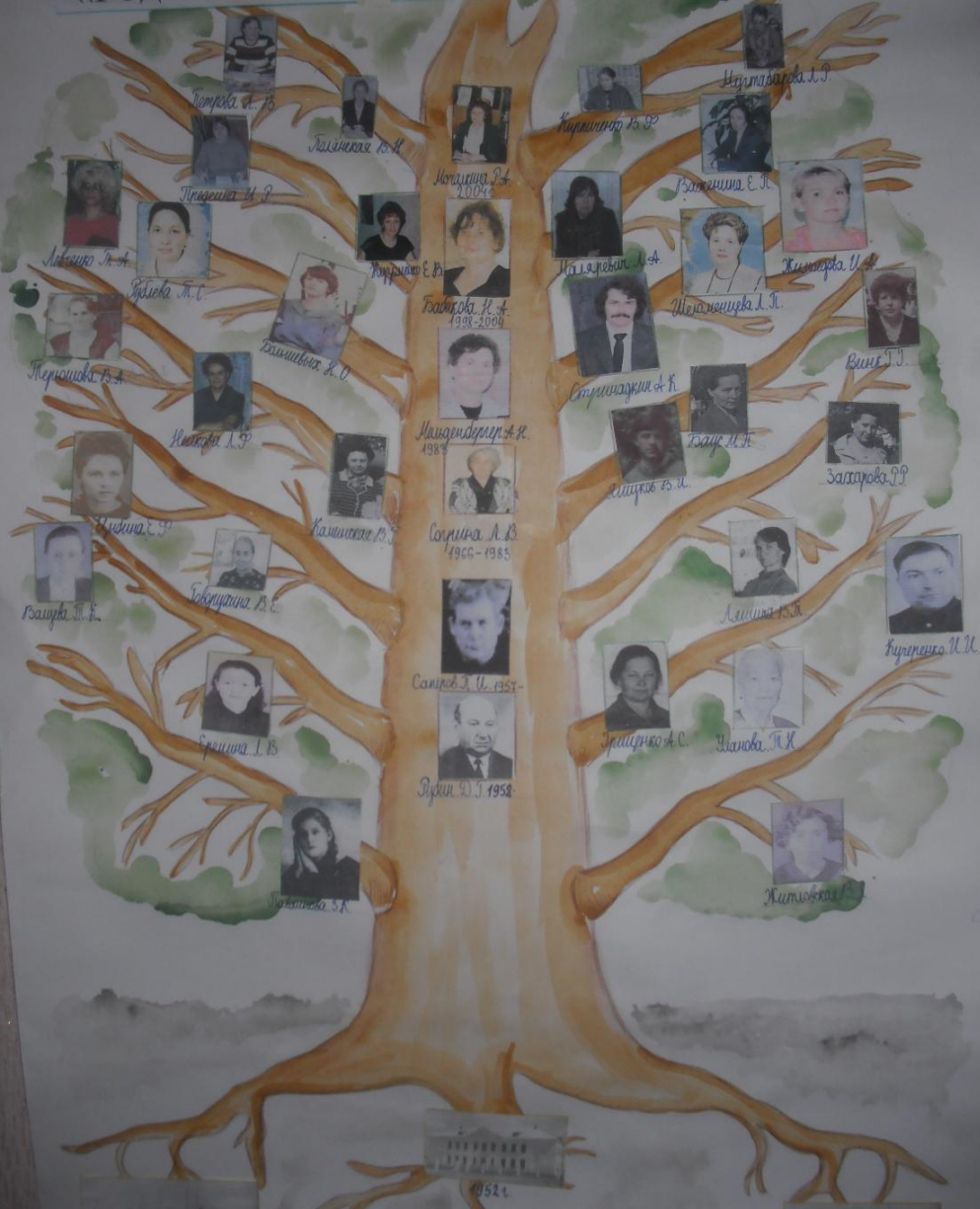
Работа учащихся 4-а класса