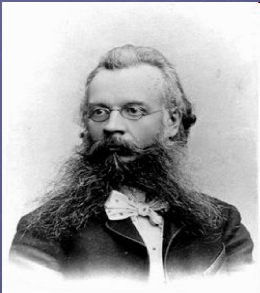
Потанин Григорий Николаевич (1835-1920)

Наиболее видными представителями раннего Сибирского областничества были Г.Н.Потанин, Н.М. Ядринцев и С.С. Шашков, создавшие в Петербурге кружок сибирской учащейся молодёжи.