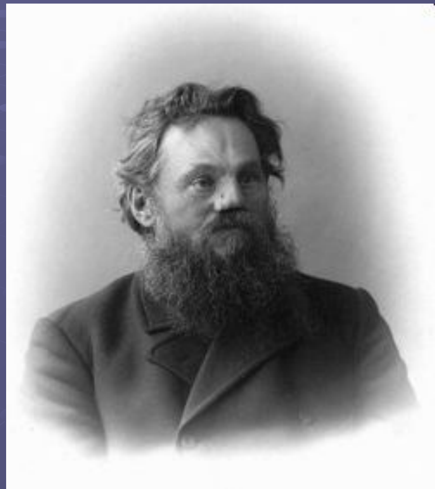
Ядринцев Николай Михайлович (1842-1894)