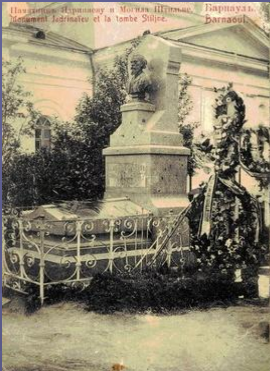
Памятник Н.М. Ядринцеву