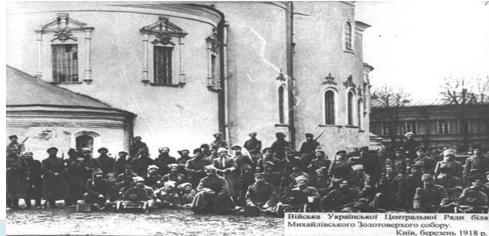
Війська Української Центральної Ради біля Михайлівського Золотоверхого собору. Київ, березень 1918 р.

Наприкінці березня 1918 р. С. Петлюра очолив Київське губернське земство , а за місяць на його базі створив та очолив Всеукраїнську спілку земств .