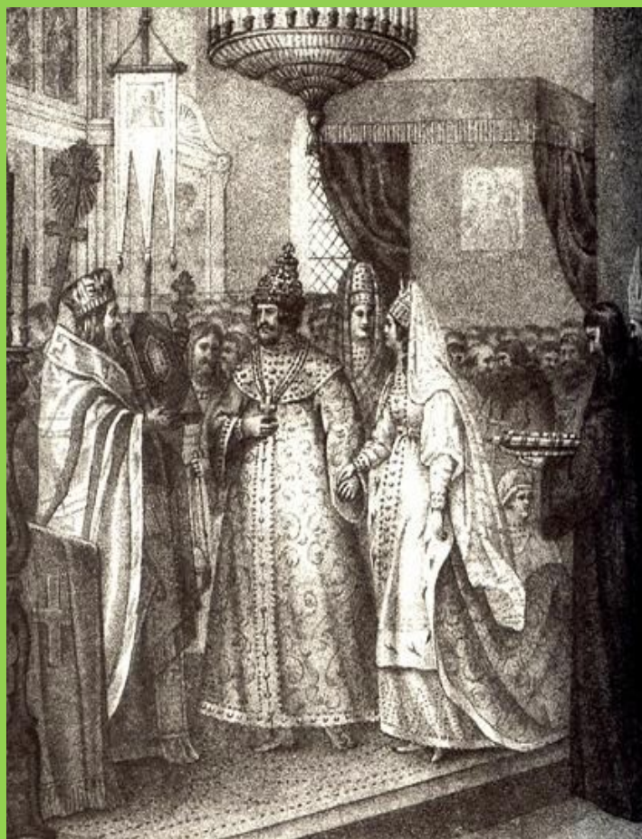
Свадьба Иоанна III Васильевича и Софьи Палеолог (1472г.)