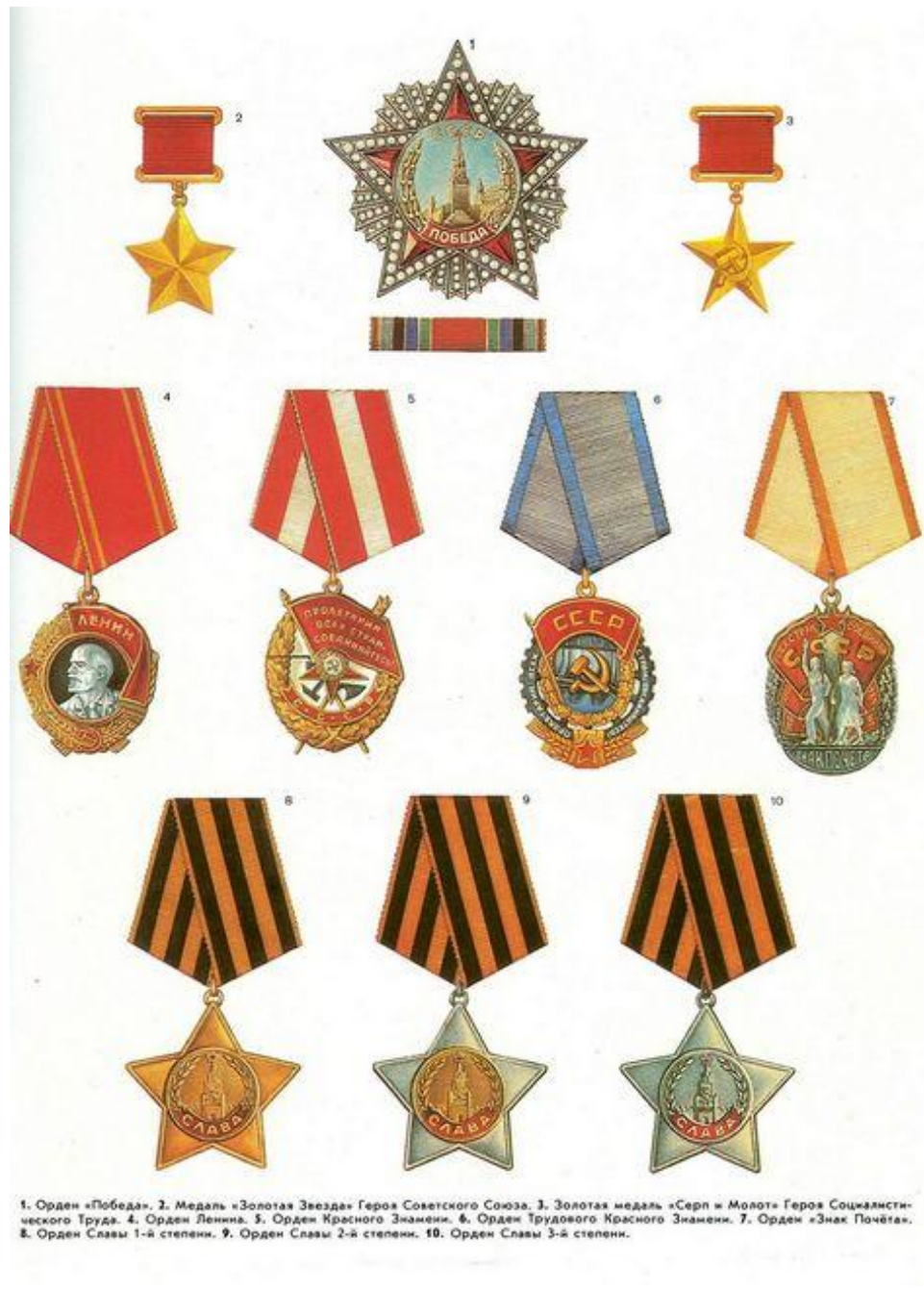
1. Орден «Победа». 2. Медаль «Золотая Звезда» Героя Советского Союза. 3. Золотая медаль «Серп и Молот» Героя Социалистического Труда. 4. Орден Ленина. 5. Орден Красного Знамени. 6. Орден Трудового Красного Знамени. 7. Орден «Знак Почёта». 8. Орден Славы 1-й степени. 9. Орден Славы 2-й степени. 10. Орден Славы 3-й степени.