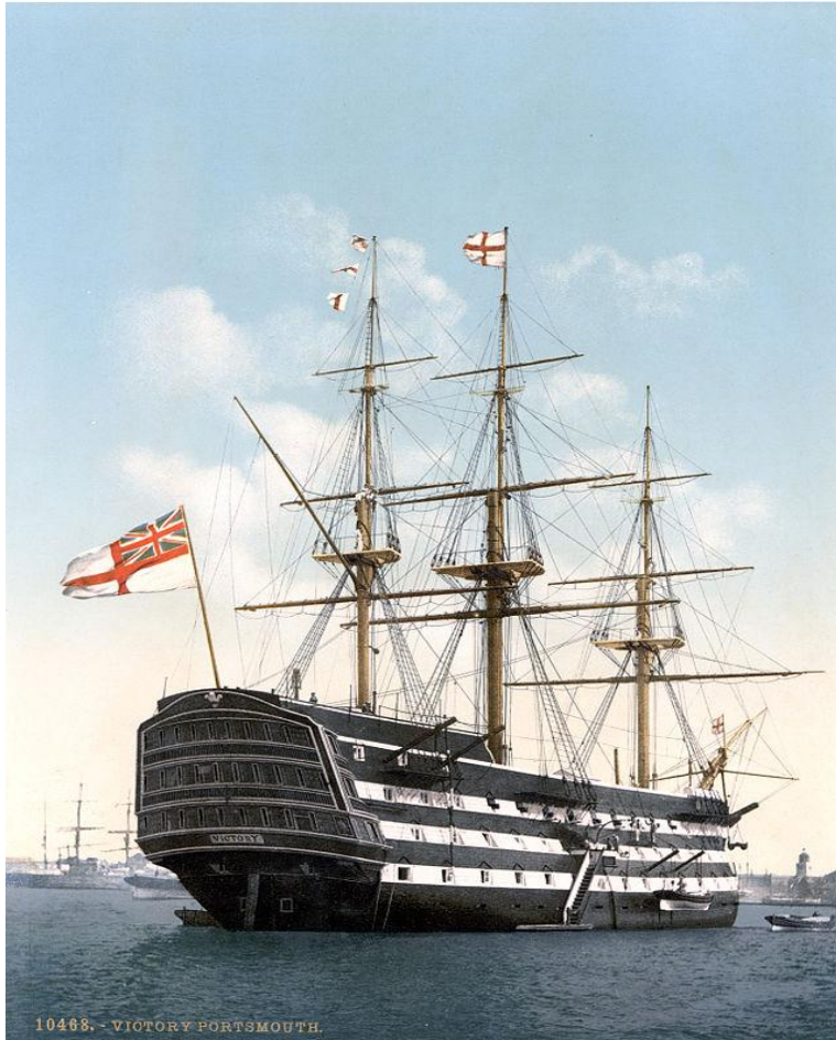
10468. - VICTORY PORTSMOUTH.

Класс парусных деревянных военных кораблей. Парусные линейные корабли характеризовались следующими особенностями: полным водоизмещением от 500 до 5500 тонн, вооружением, включающим от 30—50 до 135 орудий в бортовых портах, численность экипажа составляла от 300 до 800 человек при полном укомплектовании. Линейные корабли строились и применялись с XVII века и до начала 1860-х годов для морских боёв