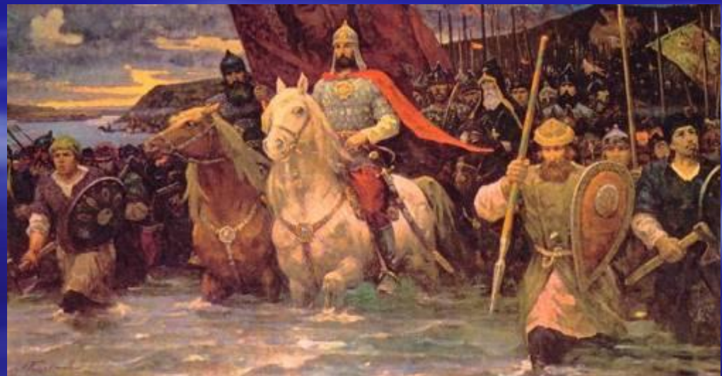
Татары ду Кубань.