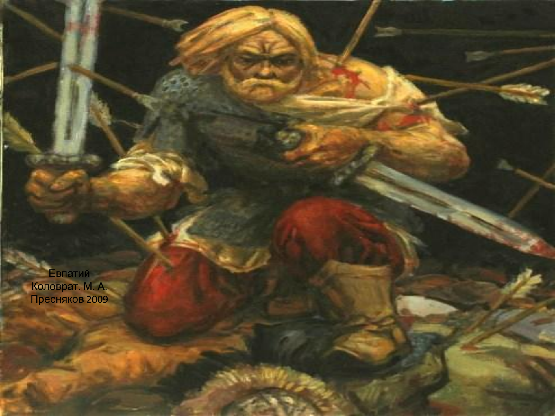
Евпатий Коловрат. М. А. Пресняков 2009