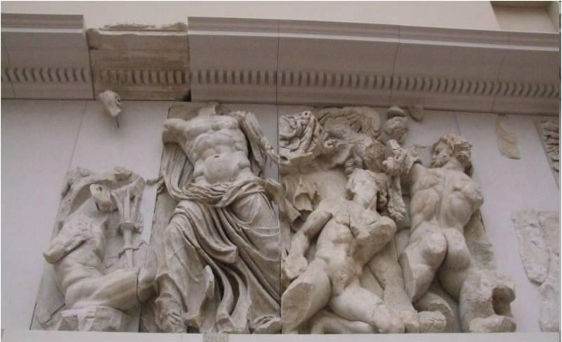
«Битва Зевса с Порфирионом»: Рельеф Алтаря Зевса, Берлинский Пергамский