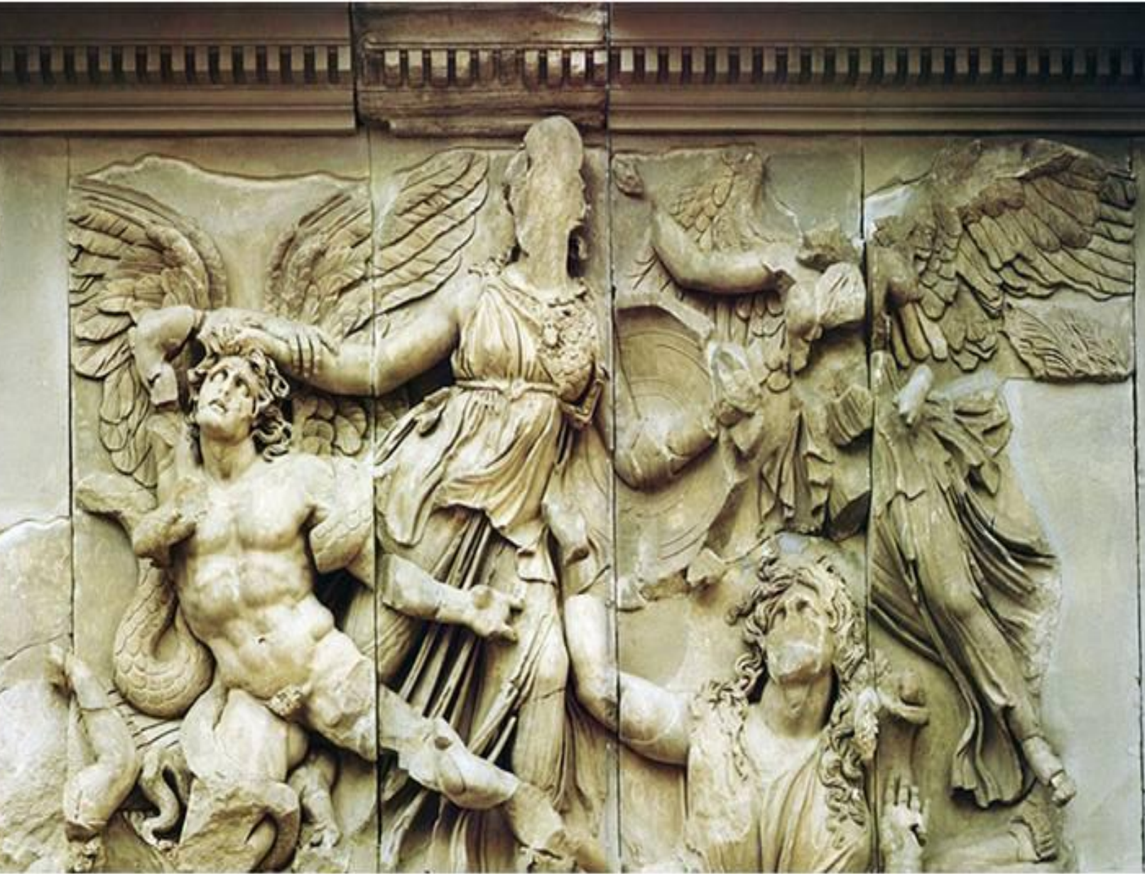
«Битва Афины с Алкионеем» Рельеф Алтаря Зевса, Берлинский Пергамский музей.