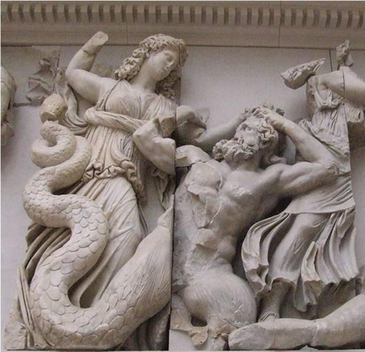
Три мойры своими бронзовыми булавами наносит смертельные удары Агрию и Фоанту. Рельеф Алтаря Зевса, Берлинский