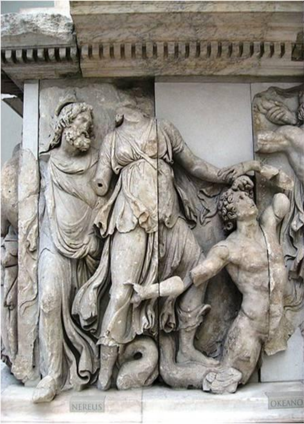
Нерей, Дорида и Океан Рельеф Алтаря Зевса, Берлинский Пергамский музей.