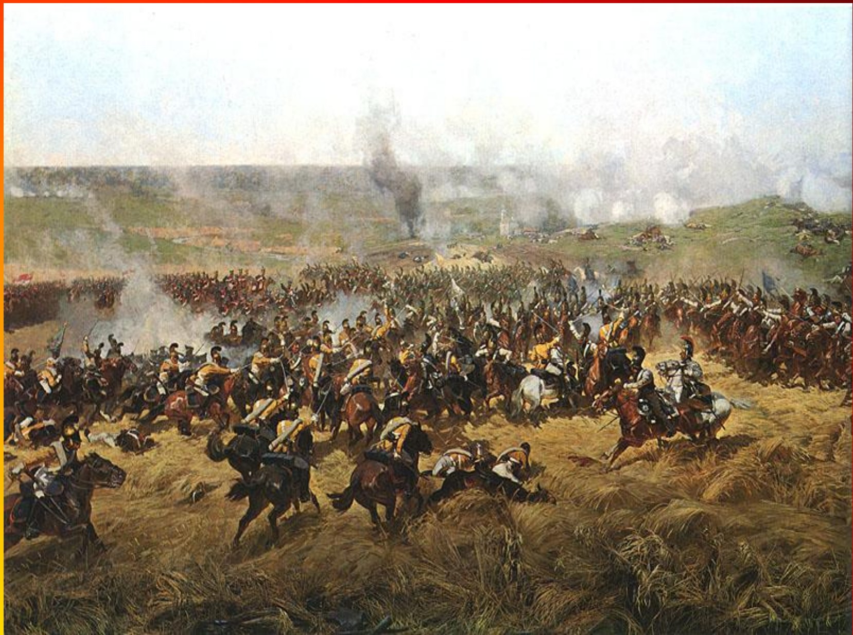
Ф.А.Рубо. Кавалерийский бой во ржи.