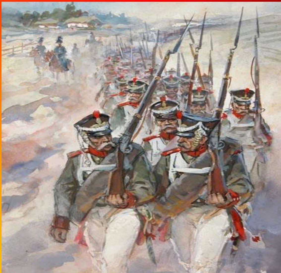
Рисунок В.Г.Шевченко к стихотворению «Бородино»