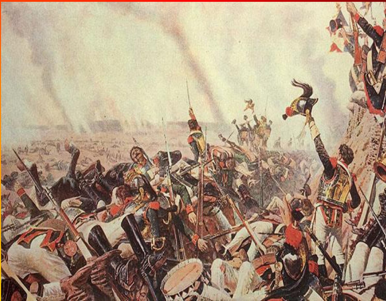
Верещагин В.В. Конец Бородинского сражения