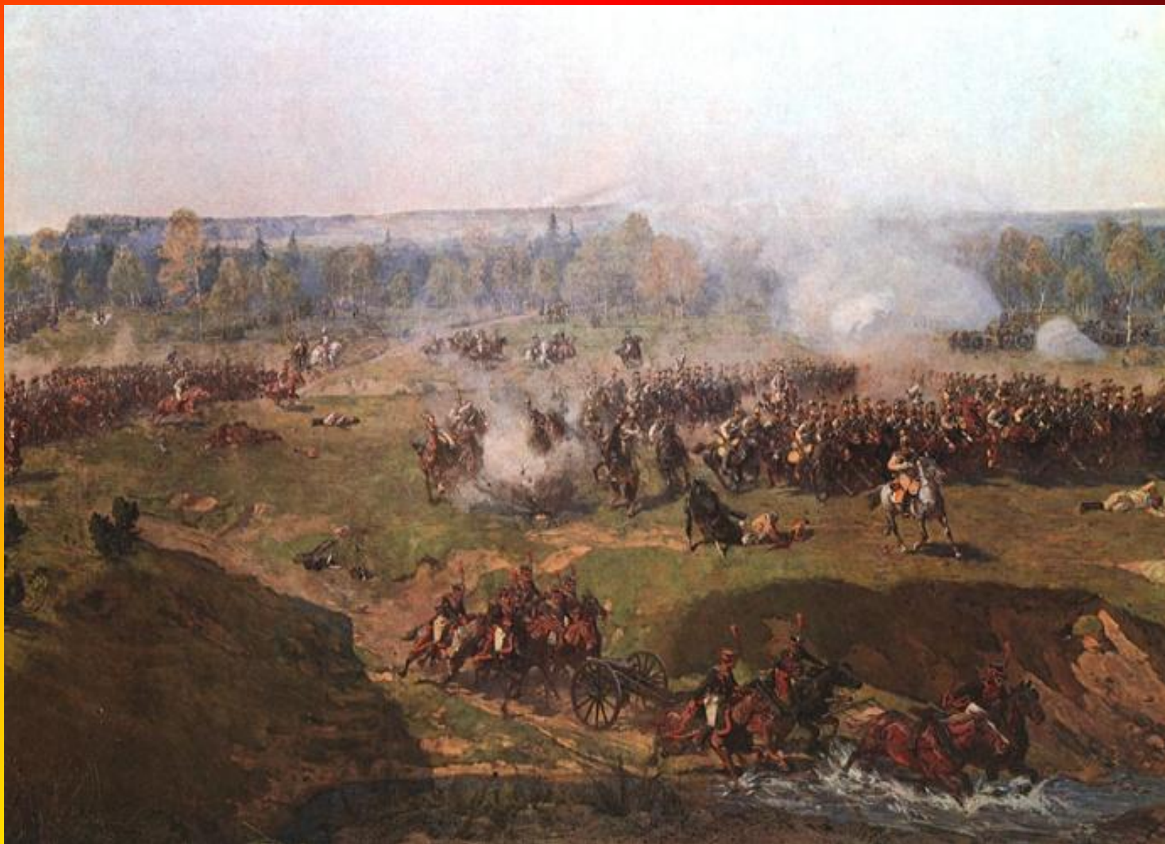
Ф.А.Рубо. Атака саксонских кирасир