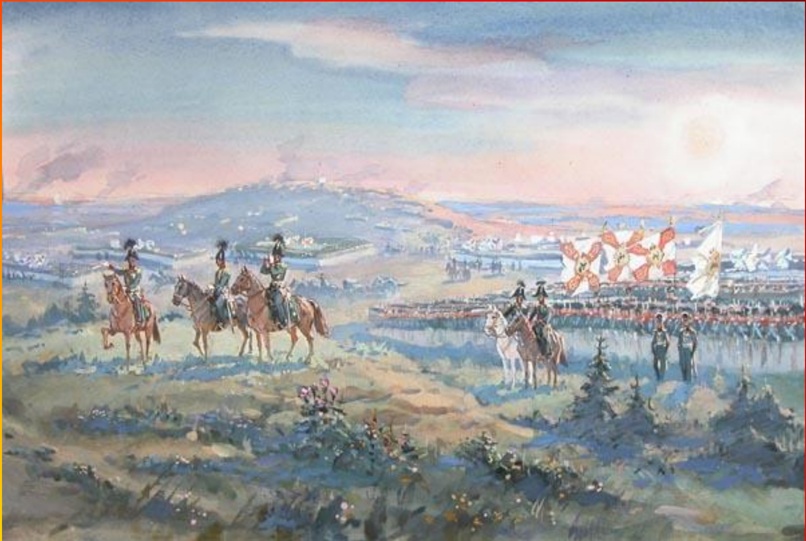
Рисунок В.Г.Шевченко к стихотворению Лермонтова М.Ю. «Бородино»