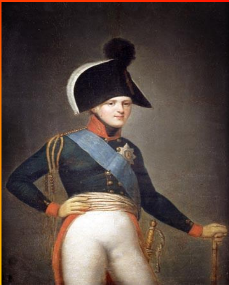
Портрет Императора Александра I. Кюгельхен Г. 1801.