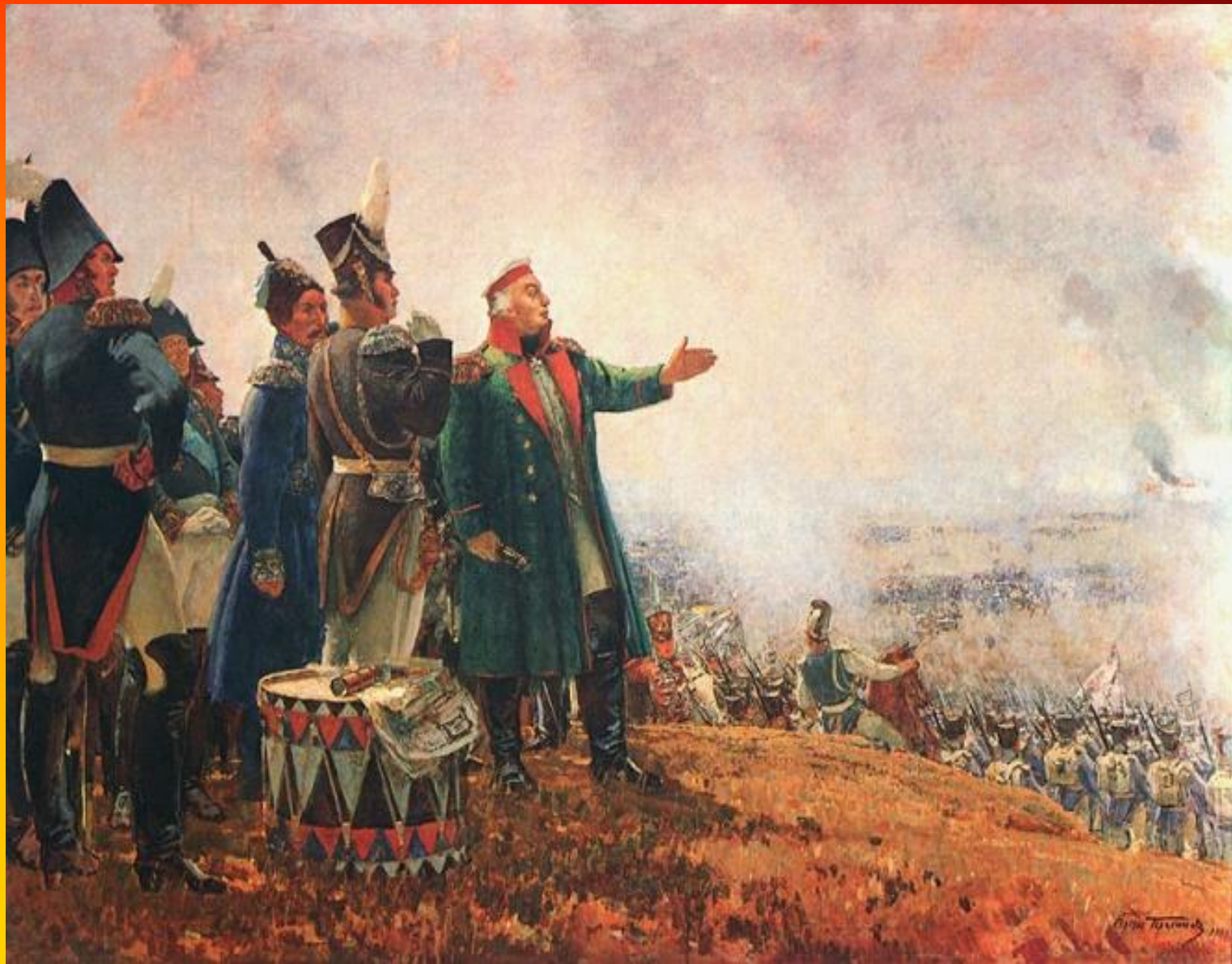
М. И. Кутузов на Бородинском поле. Художник С. Герасимов