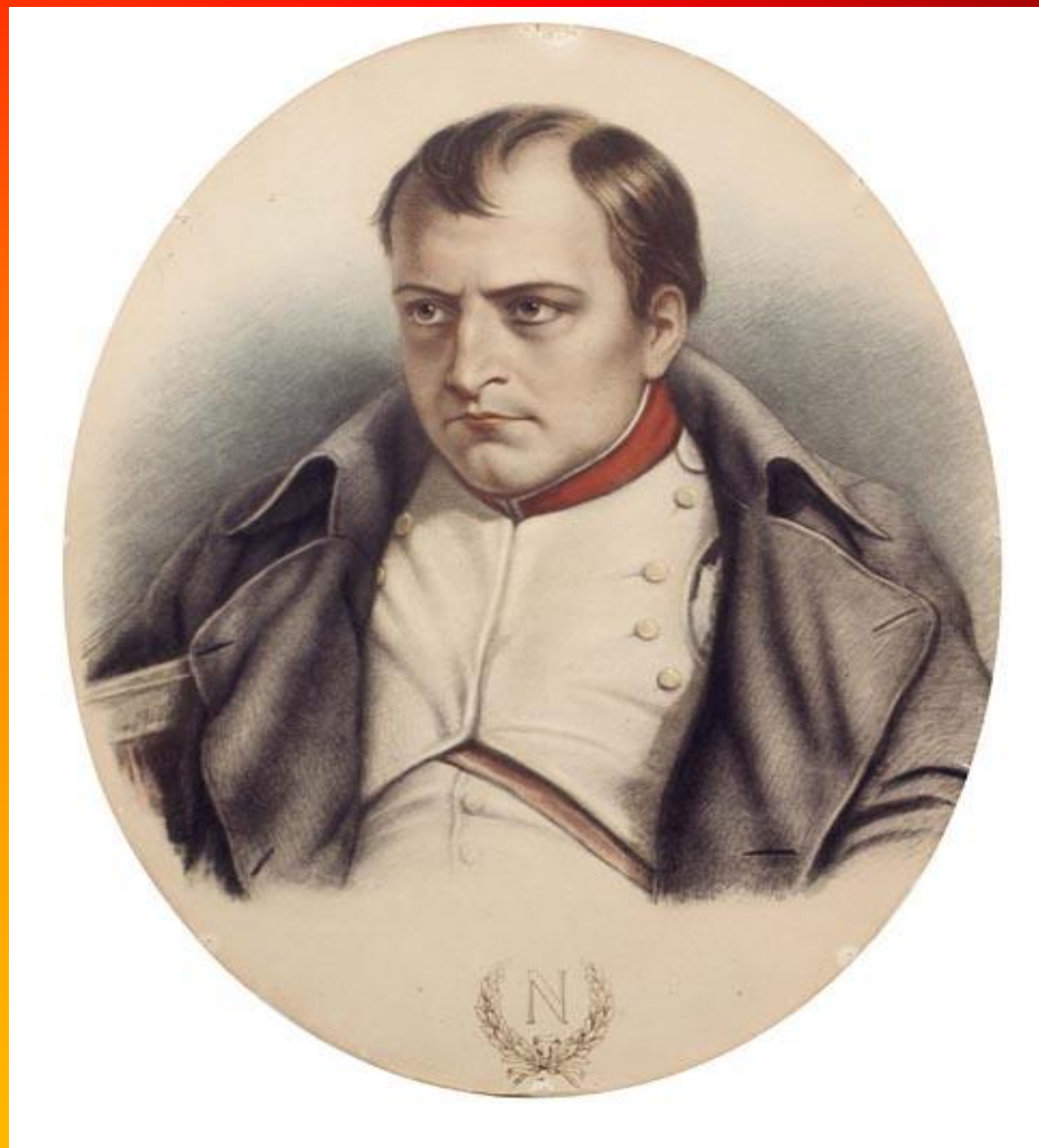
Рисунок неизвестного художника с картины Деляроша . «Наполеон в Фонтенбло».