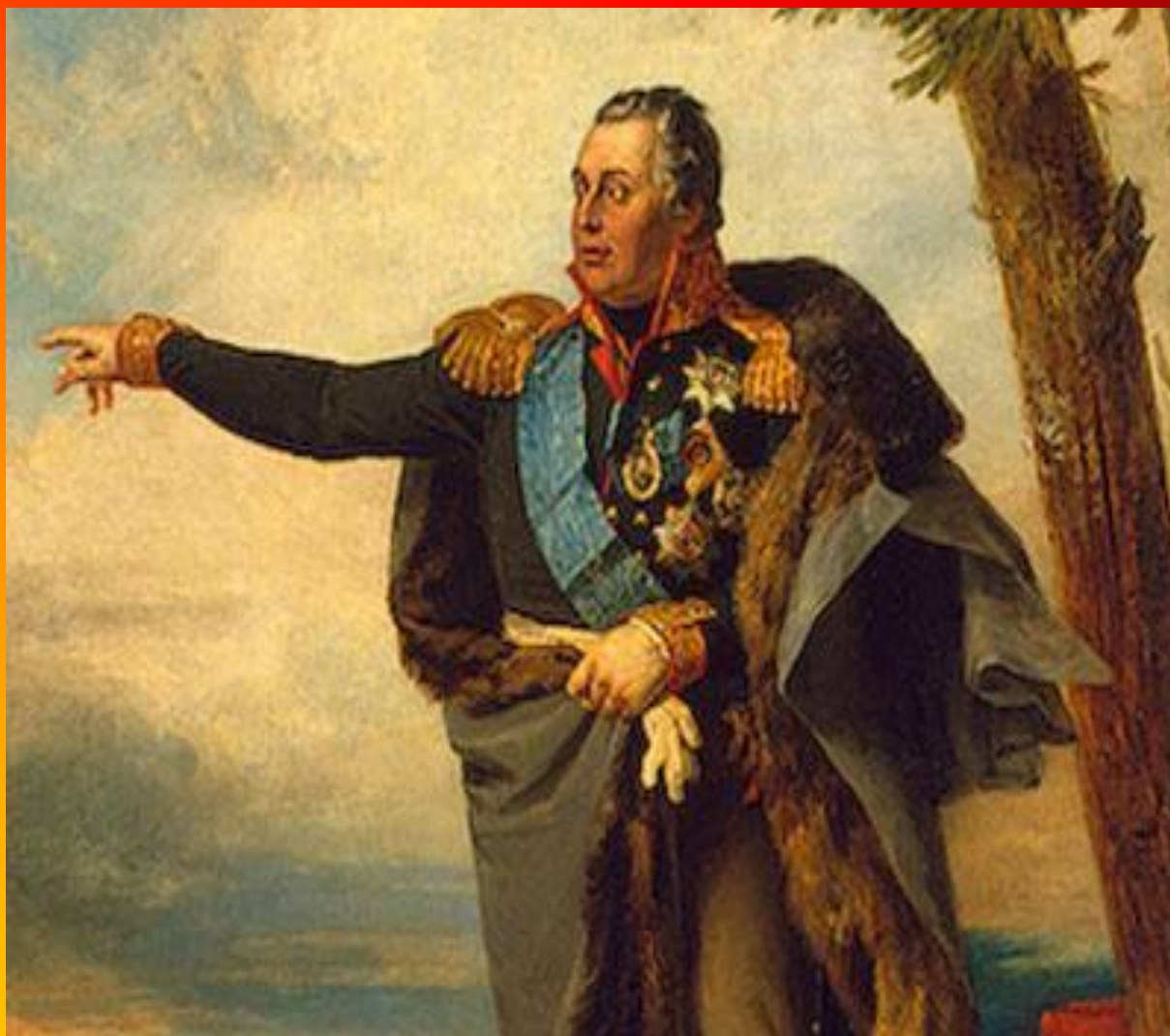
Генерал-фельдмаршал князь Михаил Илларионович Голенищев-Кутузов-Смоленский. Дж. Доу. 1829 г.