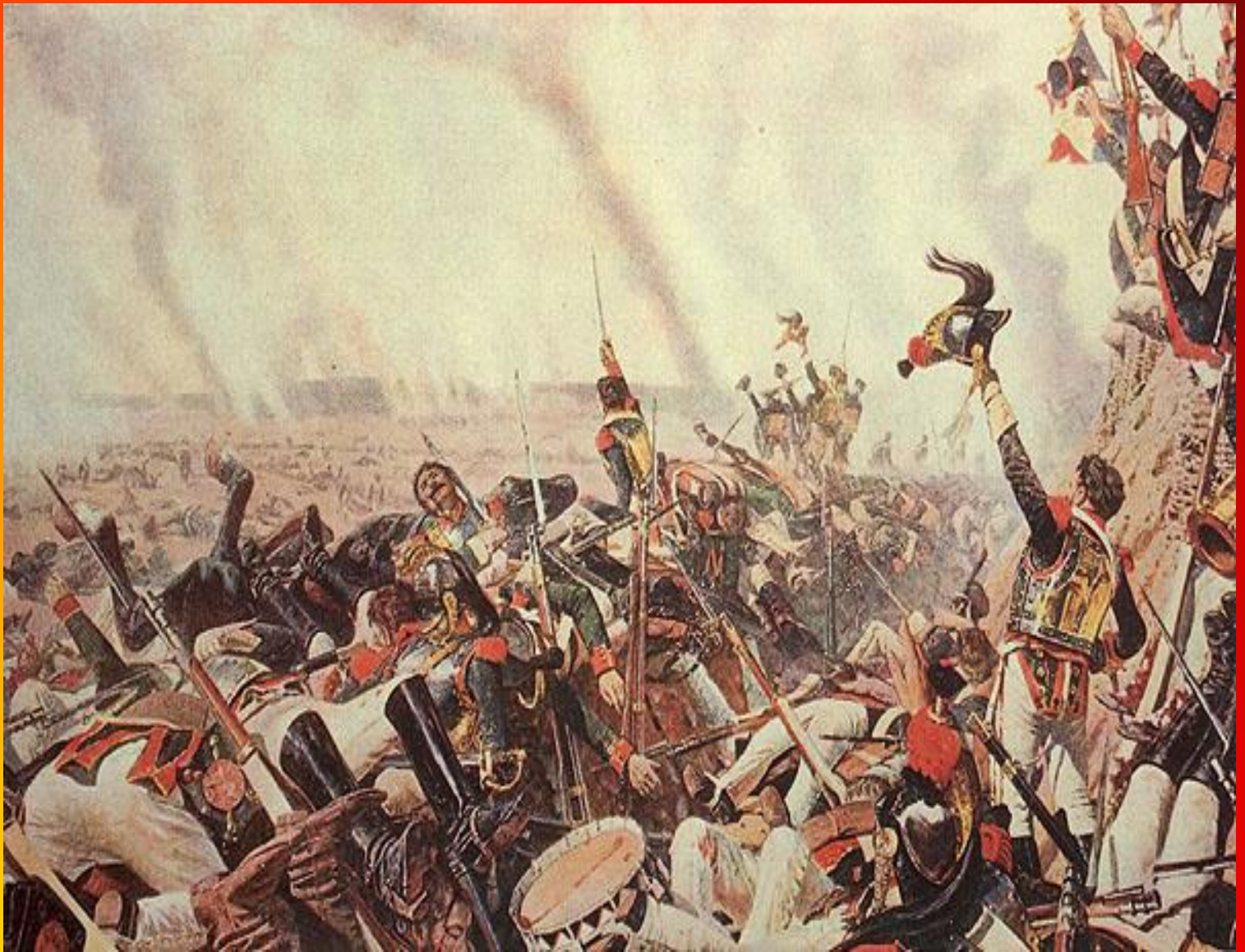
Верещагин В.В. Конец Бородинского сражения