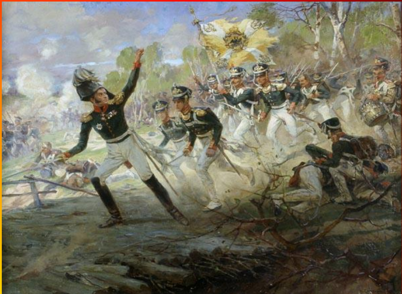
Самокиш Н.С. Подвиг солдат Раевского под Салтановкой