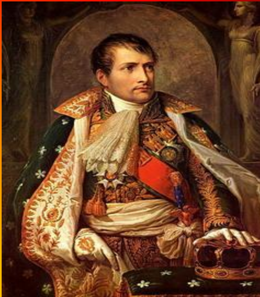
Аппиани Андреа. Портрет Наполеона.