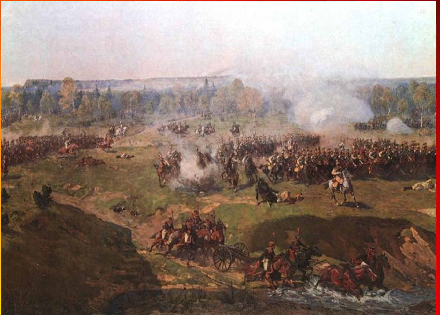
Ф.А.Рубо. Атака саксонских кирасир