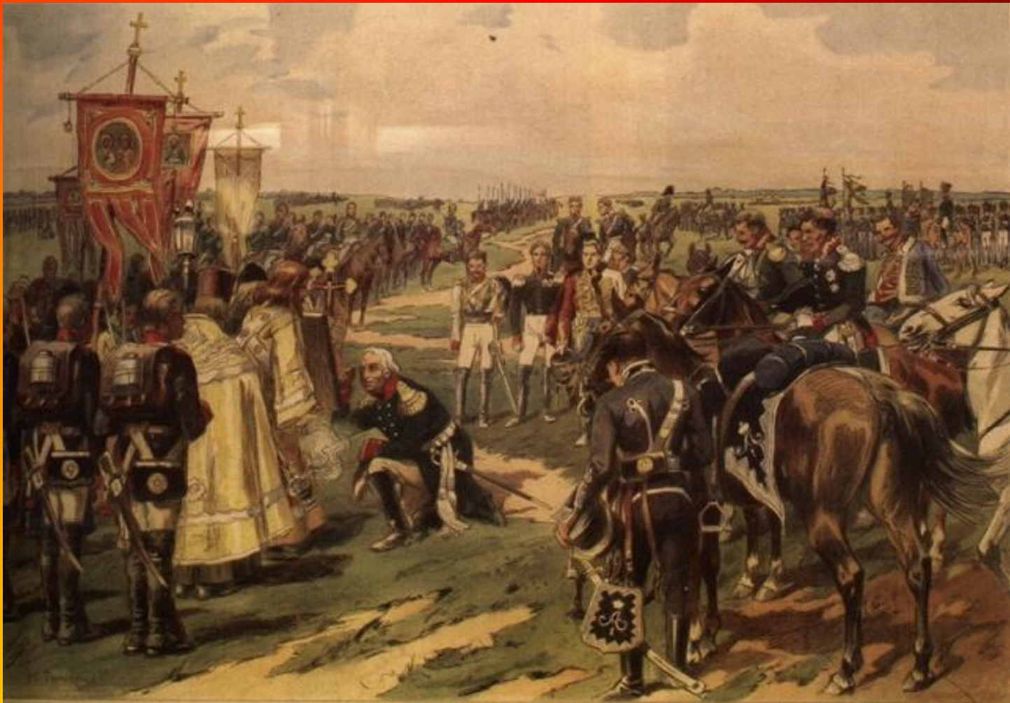
Кутузовъ молебствуетъ войскамъ 25 Августа 1812 года.