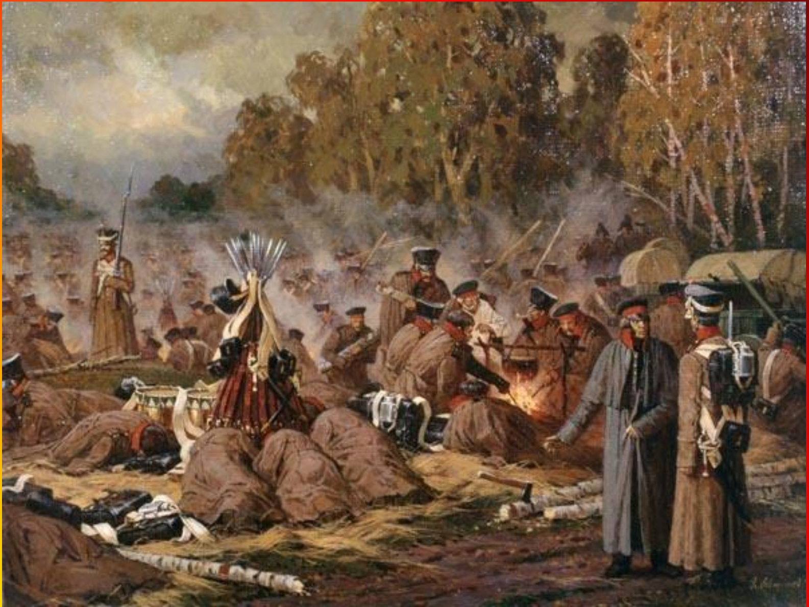
А.Ю.Аверьянов 1991 г. Бивуак