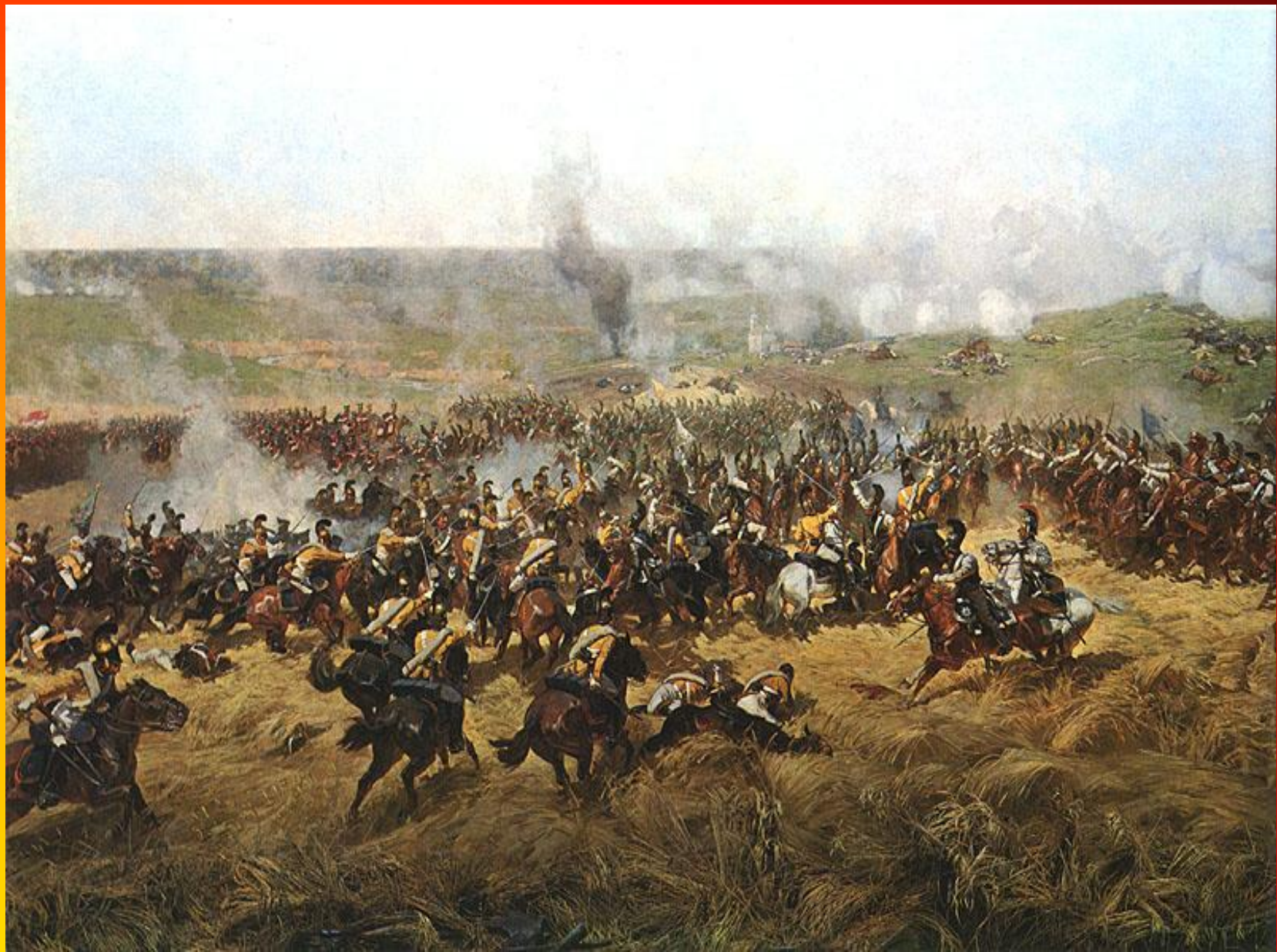
Ф.А.Рубо. Кавалерийский бой во ржи.