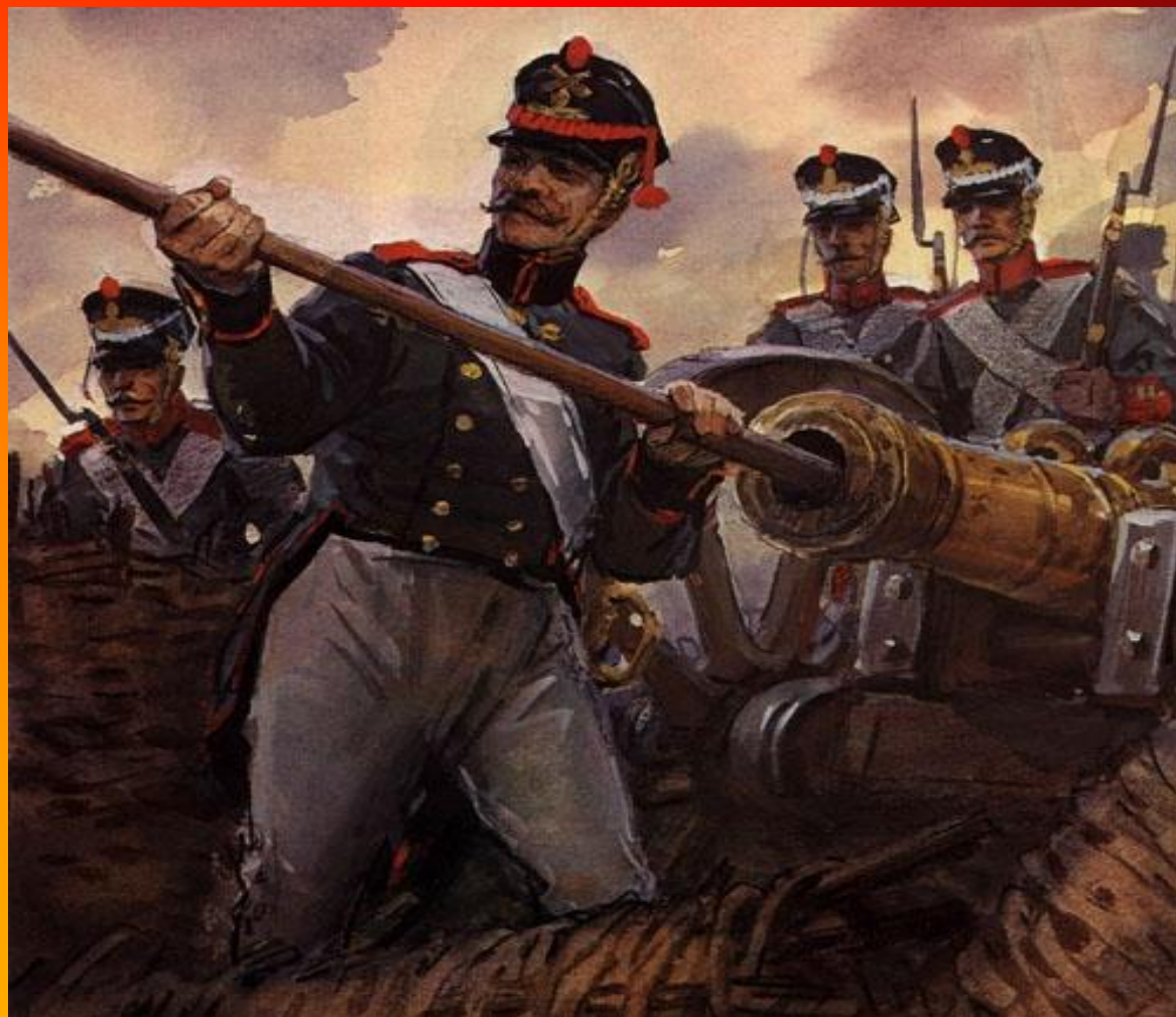
Рисунок Шевченко В.Г. Бородино.

Забил заряд я в пушку туго И думал: угощу я друга! Постой-ка, брат мусью! (Лермонтов М.Ю. Бородино)