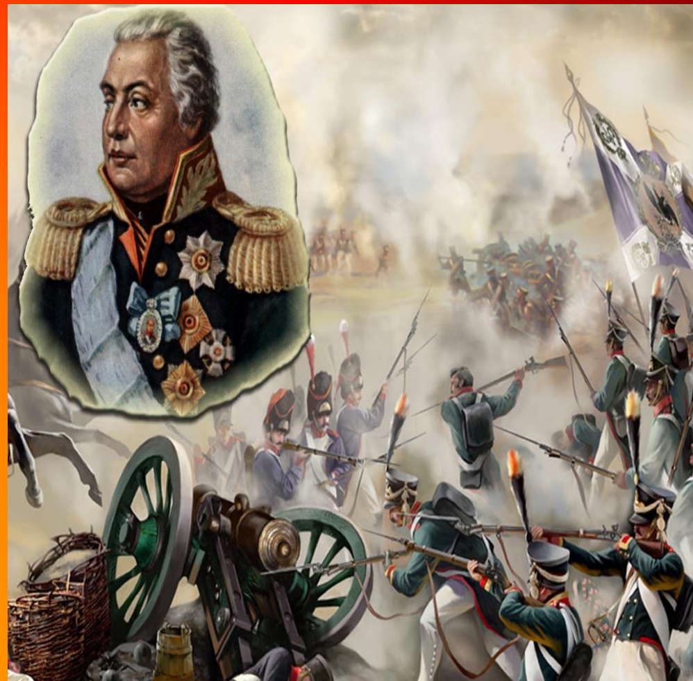
Портрет генерал-фельдмаршала М.И.Голенищева-Кутузова Волков Р.М. 1813 г.