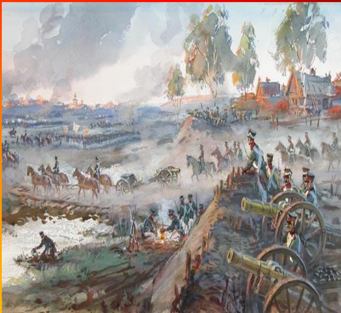
Рисунок В.Г.Шевченко. Бородино.