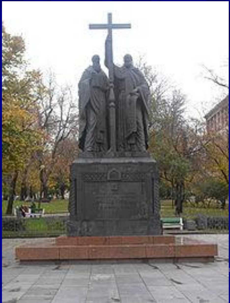
Памятник Кириллу и Мефодию в Москве