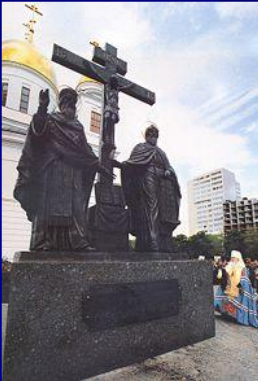
Памятник Кириллу и Мефодию в Самаре