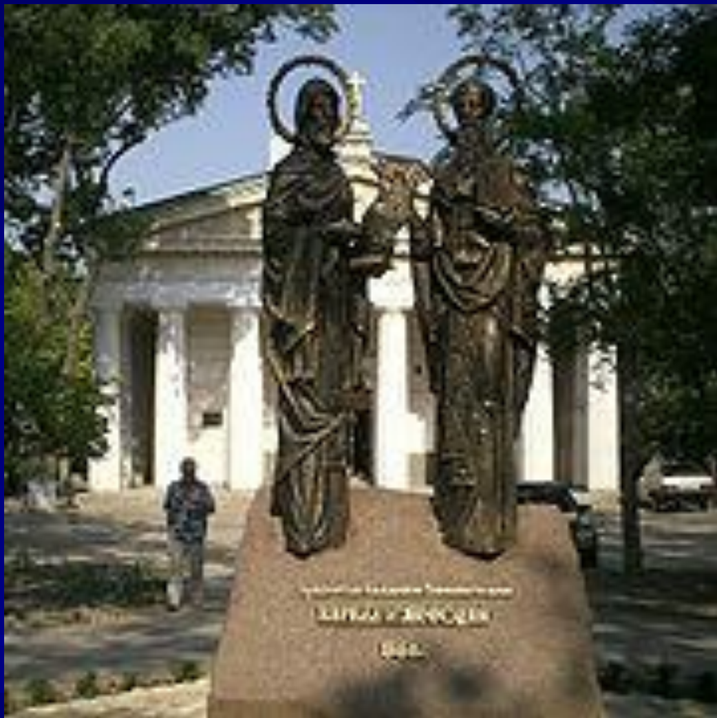
Памятник Кириллу и Мефодию в Севастополе

До пострижения в монахи братьев звали Константин и Михаил. Они были очень образованными людьми. Святые Кирилл и Мефодий своей проповедью много способствовали утверждению христианства в Болгарии, где находились примерно с 850 года. Из Болгарии христианская вера распространилась в соседнюю с ней Сербию.