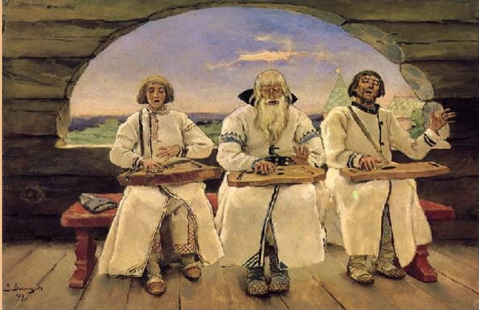
Виктор Михайлович Васнецов «Гусляры», 1899