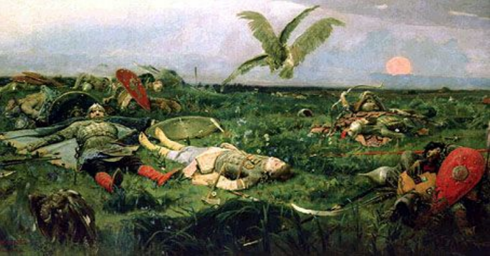
Васнецов Виктор Михайлович «После побоища», 1880