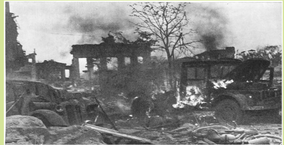
26 месяцев и 10 дней длилась оккупация Смоленщины