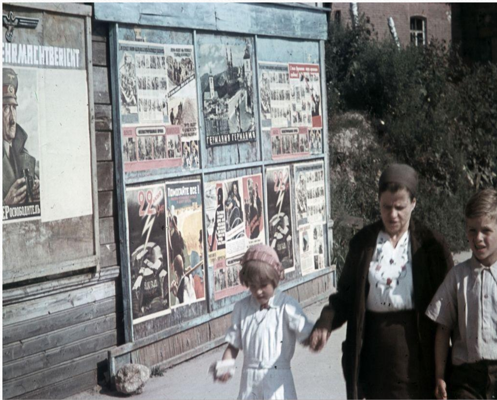
Гитлеровские агитационные плакаты.

Немецкая агитация на оккупированных территориях на плакатах. Город жил своей жизнью. Повсюду была агитация о пользе немецкого режима.