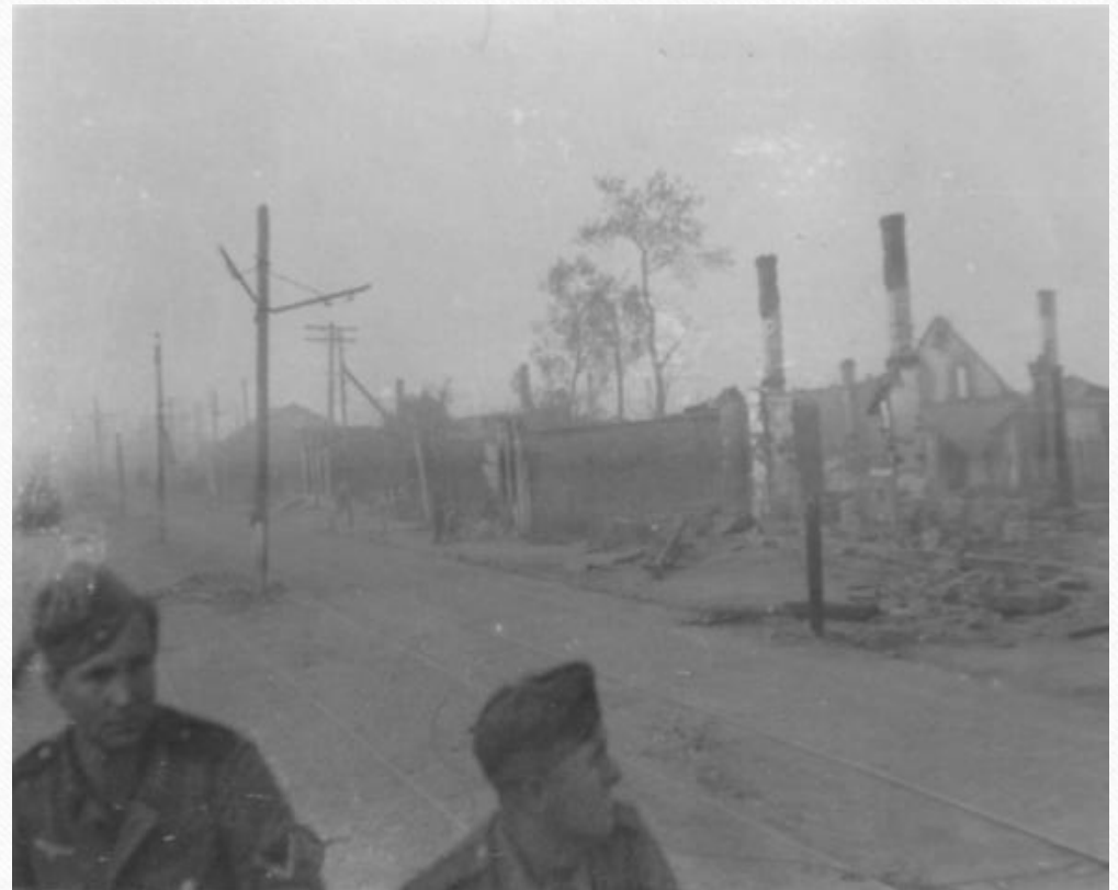
Окраины г. Смоленска. июнь 1941г