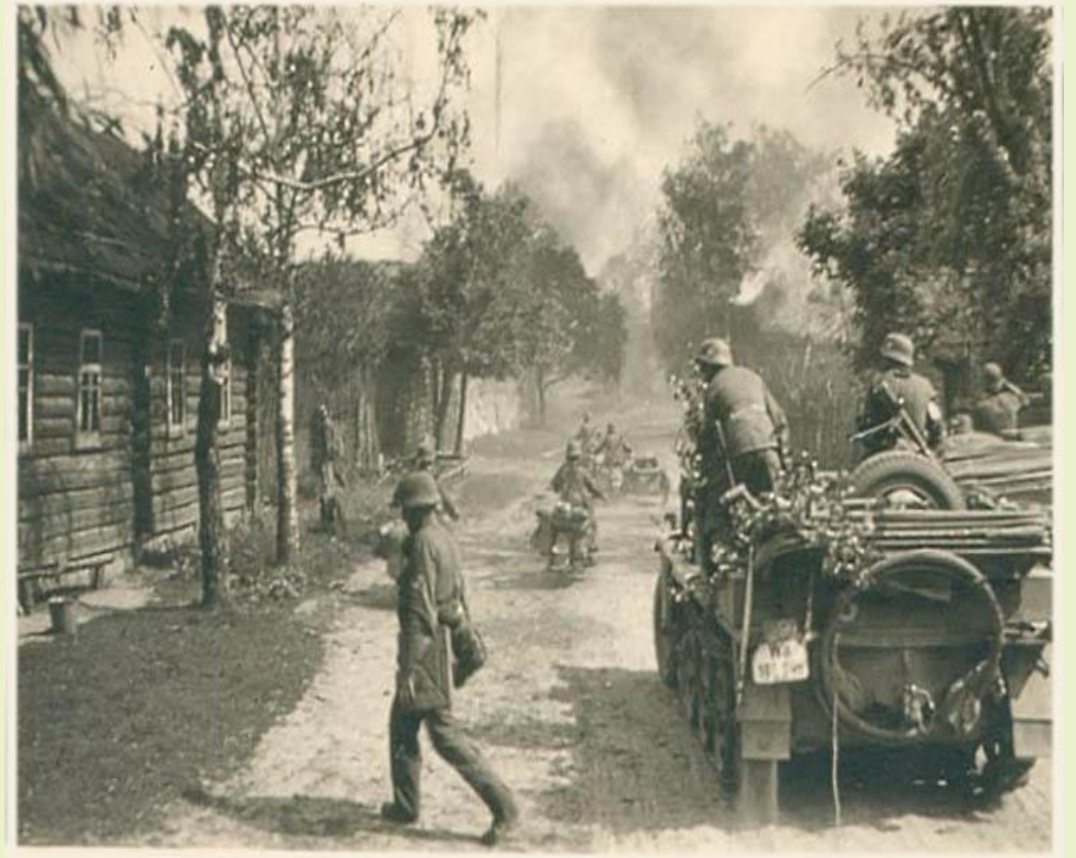
Окрестности Ярцево Смоленской области

http://photochronograph.ru/2011/12/26/vtoraya-mirovaya-vojna-plan-barbarossa/