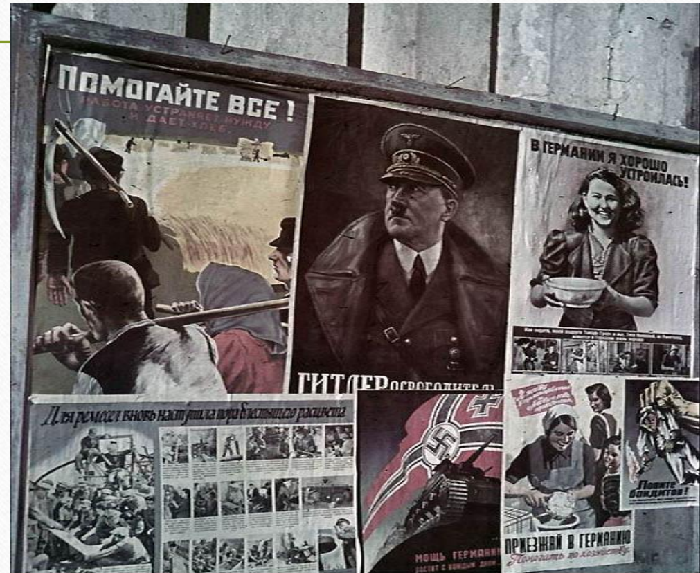
Гитлеровские агитационные плакаты.