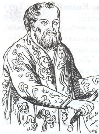
Д. М. Пожарский.