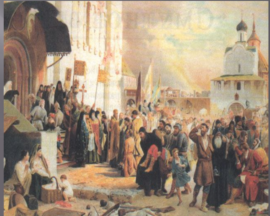
Верещагин В. Польская интервенция