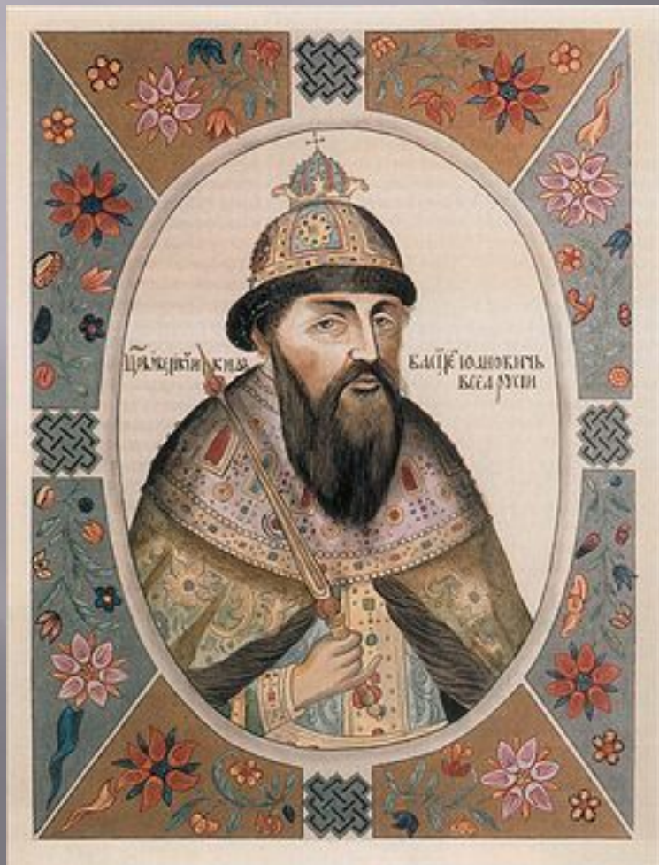
Василий Шуйский 1606-1610 гг.