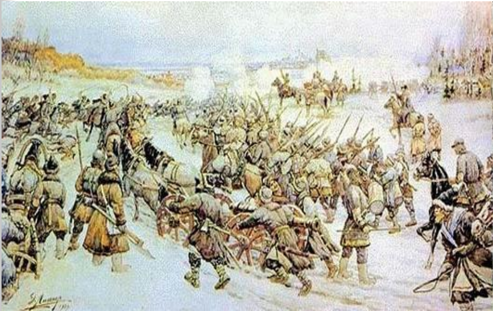
Войско Болотниково под Москвой. Художник Э. Лисснер