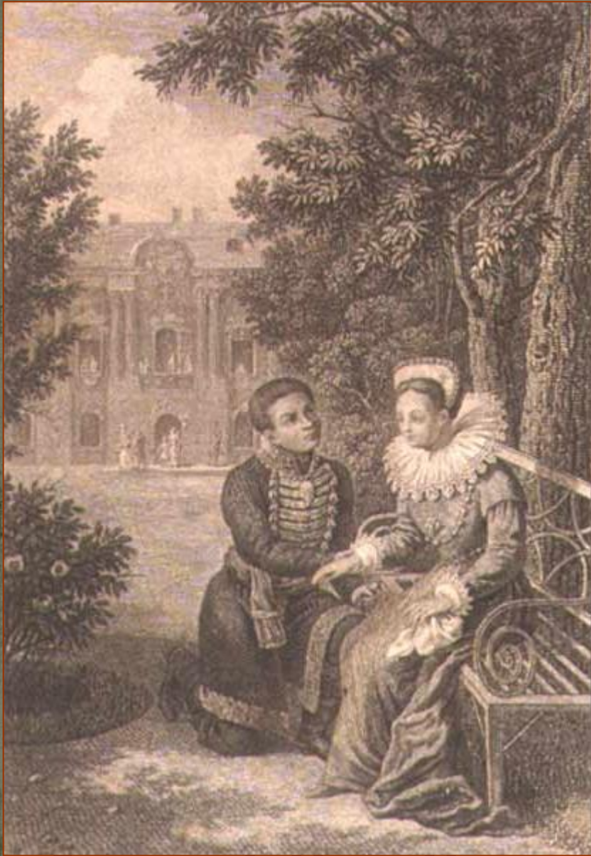
Лжедмитрий I и Марина Мнишек

Новый царь раздал должности полякам, остальные обещания не выполнил. В мае состоялась его свадьба с Мариной Мнишек (дочерью польского воеводы).