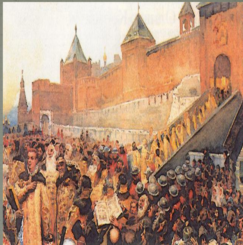
Вступление войск Лжедмитрия I в Москву