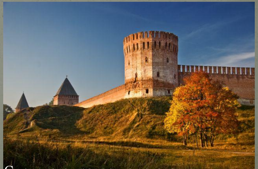
Смоленска крепостная стена