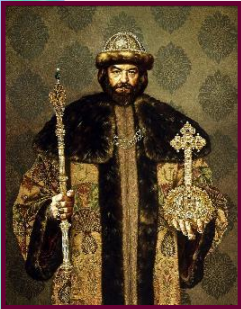
С.Присекин. Борис Годунов

Новым царем был избран Борис Годунов. Но он отказался занять престол. Только в сентябре 1598 г. разбив крымских та-тар Борис короновался.