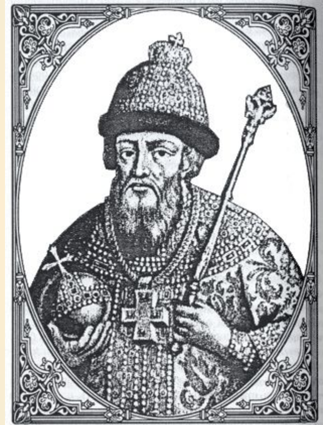
Василий Шуйский 1606 – 1610 гг.