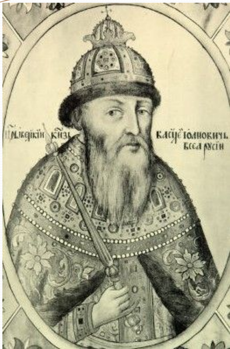
Василий Иванович Шуйский