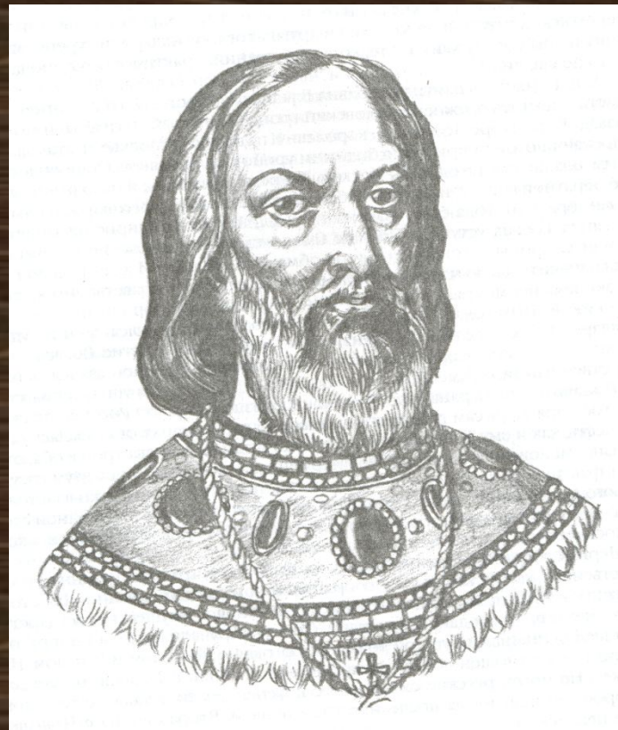
Отец царя – патриарх Филарет.