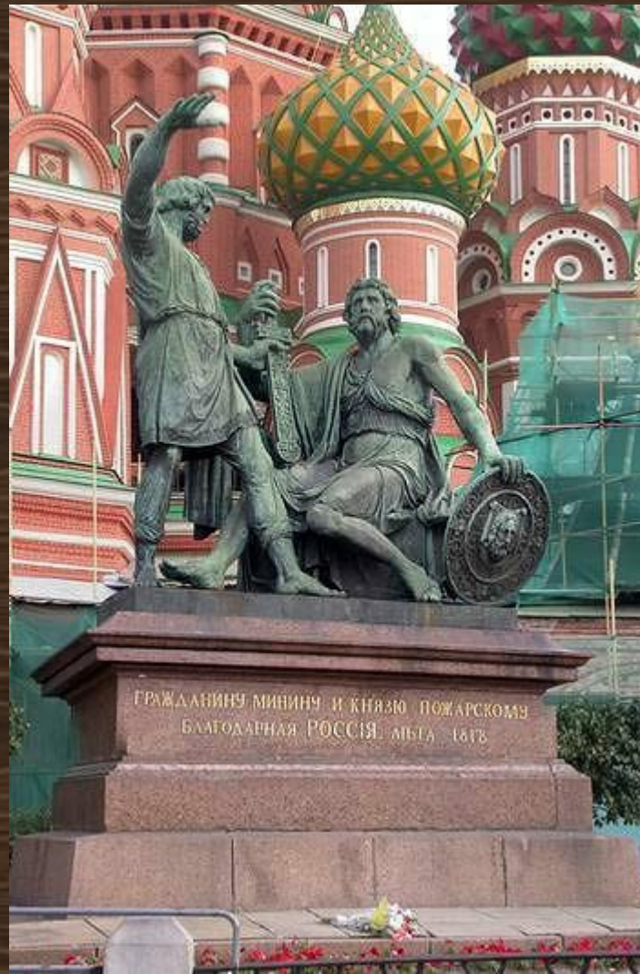
«Гражданину Минину и князю Пожарскому Благодарная Россия. 1818 г.