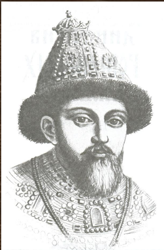
Царь Михаил Романов.

Избрание Михаила Романова на царский престол.