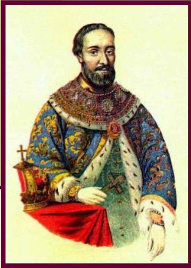
Тушинский патриарх Филарет