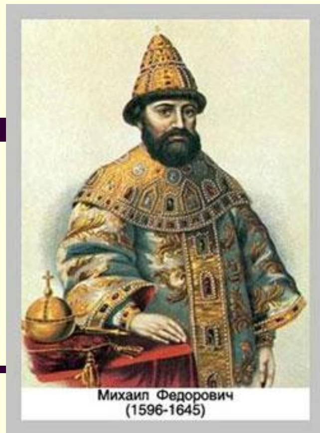
Михаил Федорович (1596-1645)