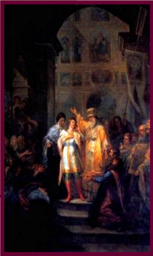
Г.Угрюмов. Призвание Михаила Федоровича Романова на царство.

В 1613 году на Земском соборе был избран новый царь. Им стал Михаил Федорович Романов