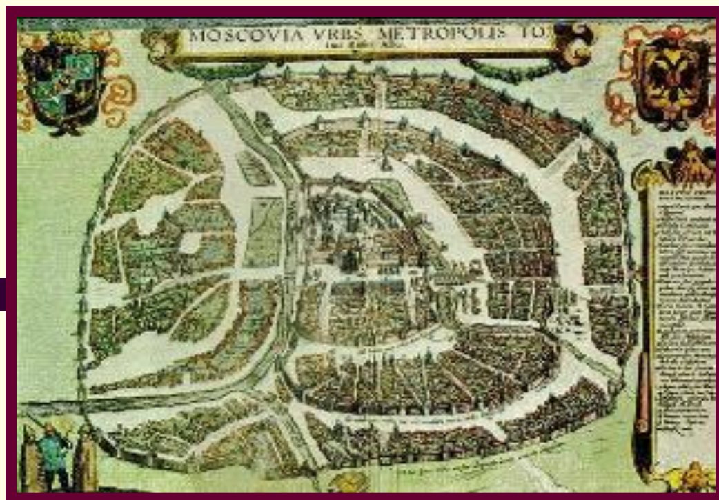
План Москвы 1610 г