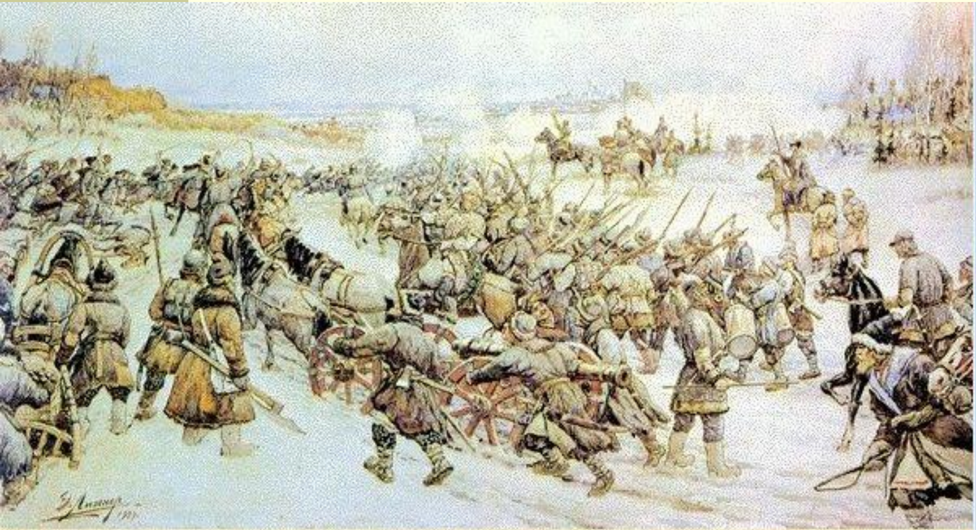
Э. Лиснер. Восстание И. Болотникова.