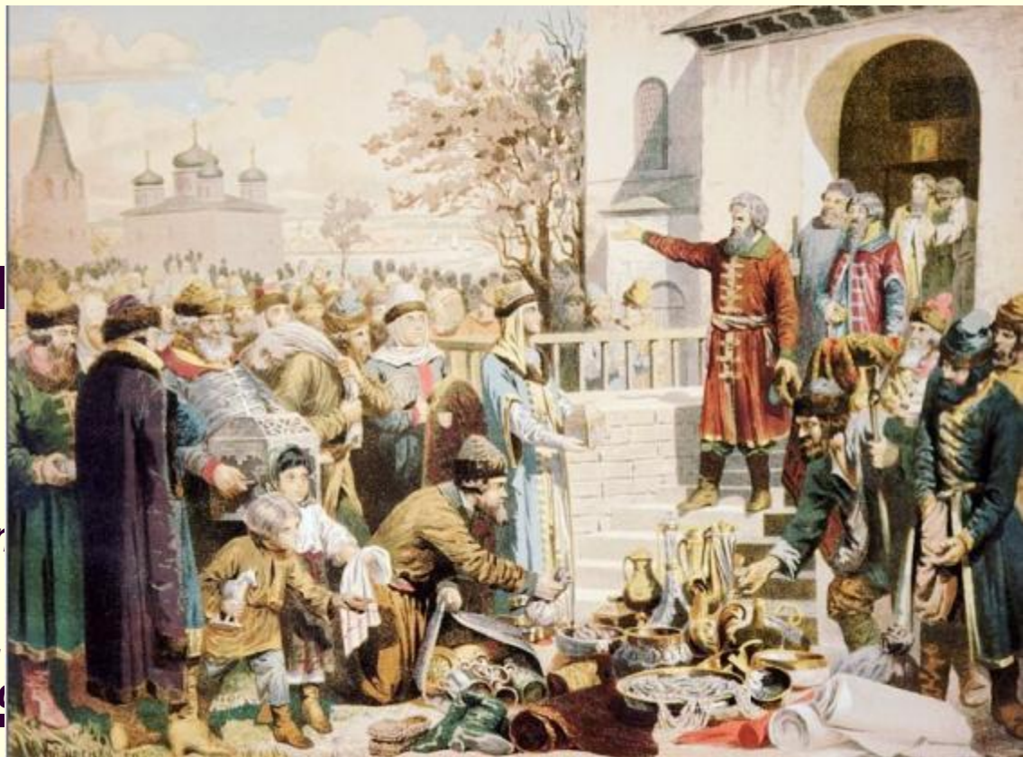
К.Маковский. Минин на площади Нижнего Новгорода, призывающий народ к жертвованиям

Отчизну, родину любя, Нательный крест снимите с себя!