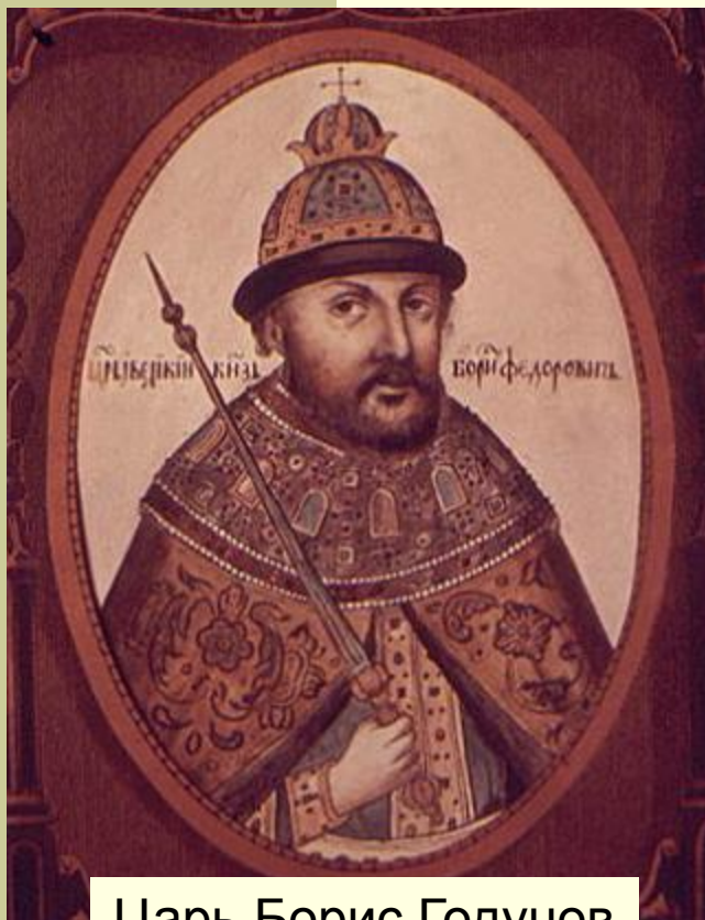
Царь Борис Годунов 1598-1605 гг

Годунов оказался неудачливым царем, а значит – и незаконным.