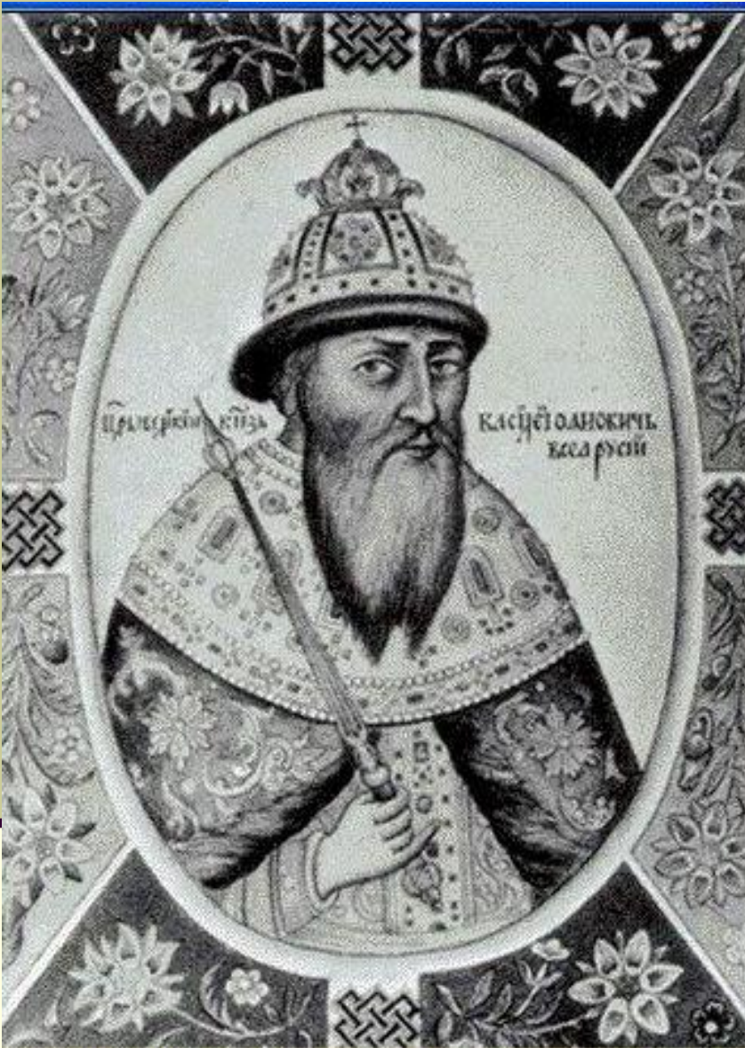
Василий Шуйский. Миниатюра из 'Титулярника' 1672г.

Дал крестоцеловальную запись: впервые царь присягнул подданным. Но на практике Шуйский часто нарушал клятву.