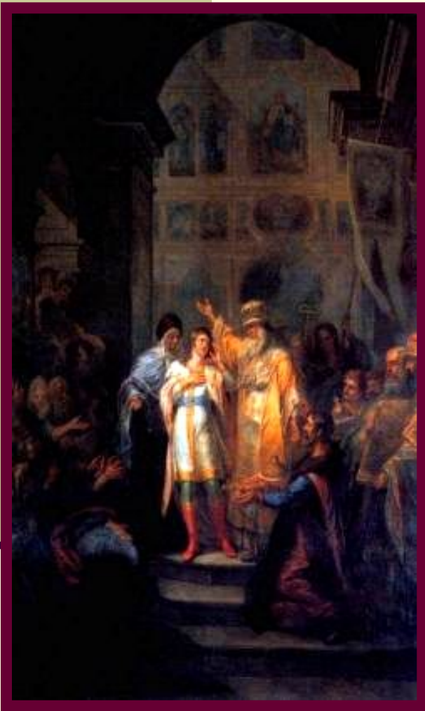
Г.Угрюмов.Призвание Михаила Федоровича Романова на царство.

В 1613 году на Земском соборе был избран новый царь. Им стал Михаил Федорович Романов