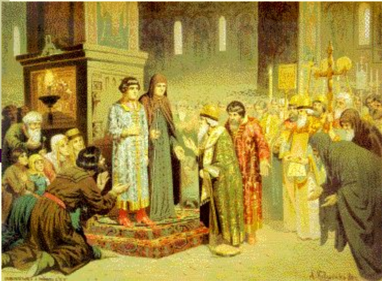
Призвание Михаила Романова на царство.