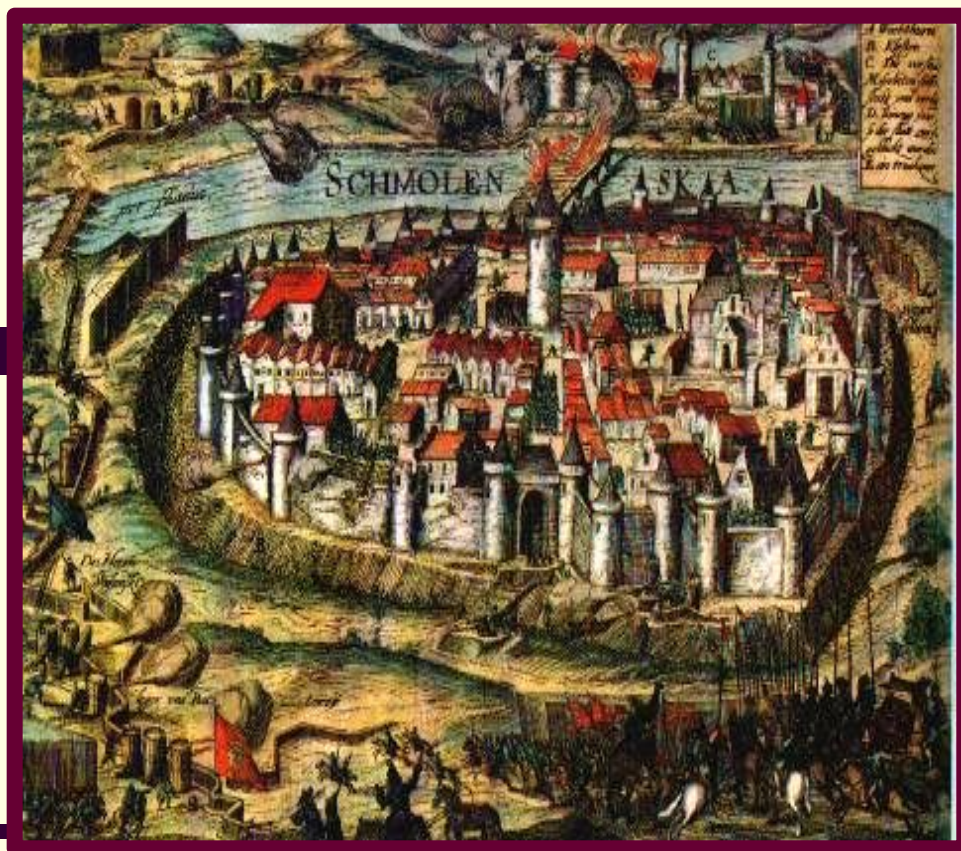
Осада Смоленска польскими войсками. Миниатюра начала. XVII в.