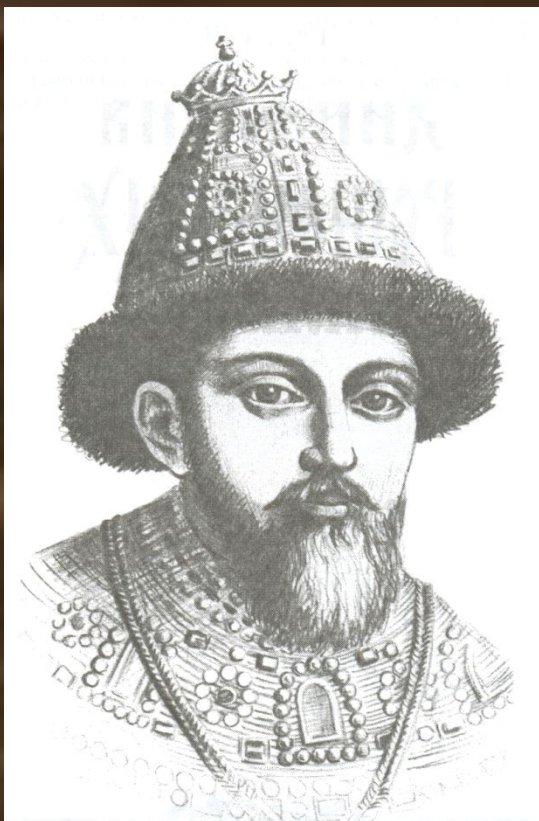
Царь Михаил Романов.

Избрание Михаила Романова на царский престол.