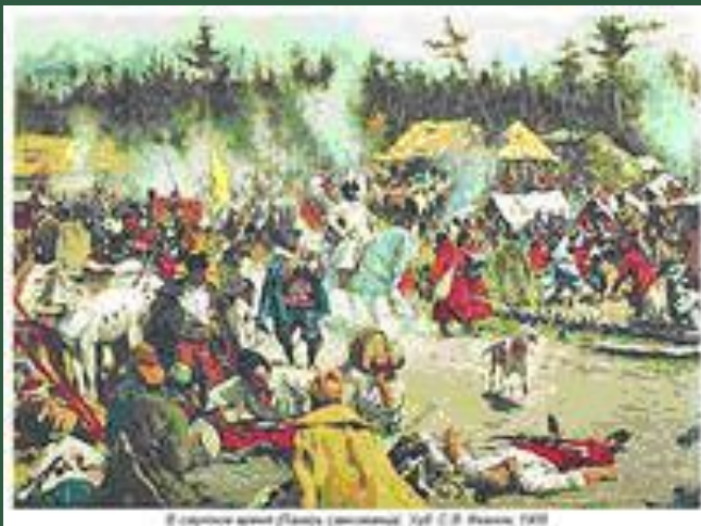
Вспомогательный лагерь Лжедмитрия II в Тушине, 1609

Несмотря на то, что контролировал большую часть русского государства, в отличие от Лжедмитрия I, царем не считался.