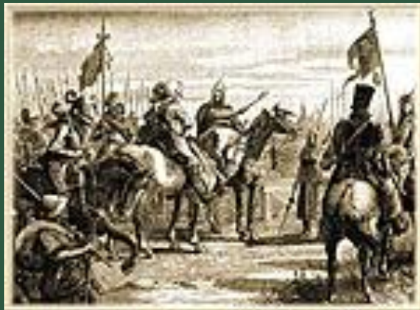
Шведы на пути к Новгороду