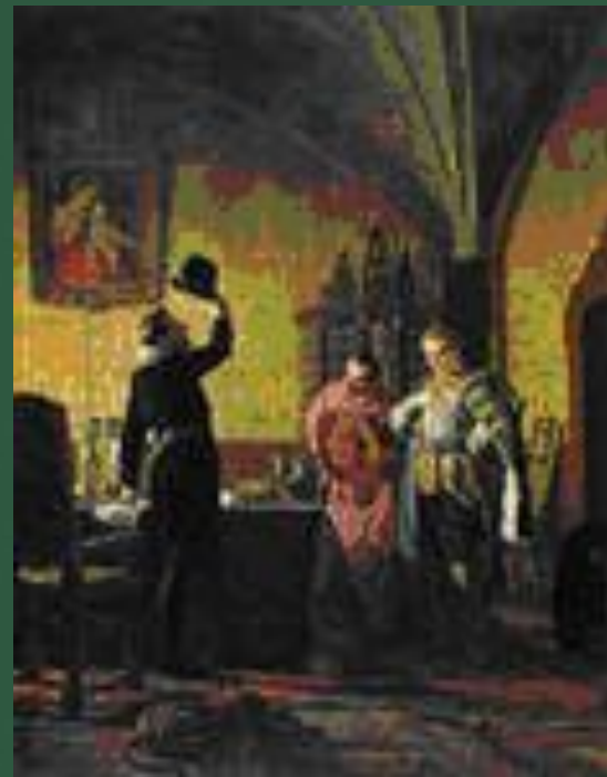
Лжедмитрий I присягает польскому королю

Польский король Сигизмунд III поддержал Лжедмитрия I и предоставил ему 4-тысячный военный отряд.