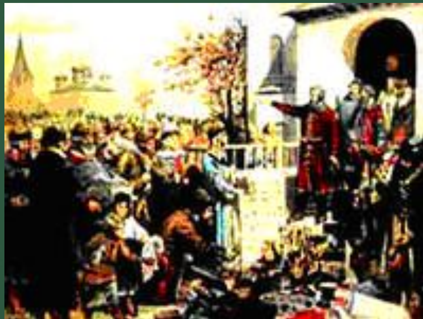
Минин призывает народ к жертвованию