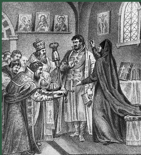
Борису Годунову сообщают об избрании на царство