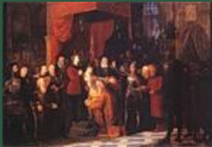
Пленный В.Шуйский в Варшаве

Его участь в конце жизни – свержение с престола, тайное подстрижение в монахи, польский плен и смерть в тяжелых лишениях.