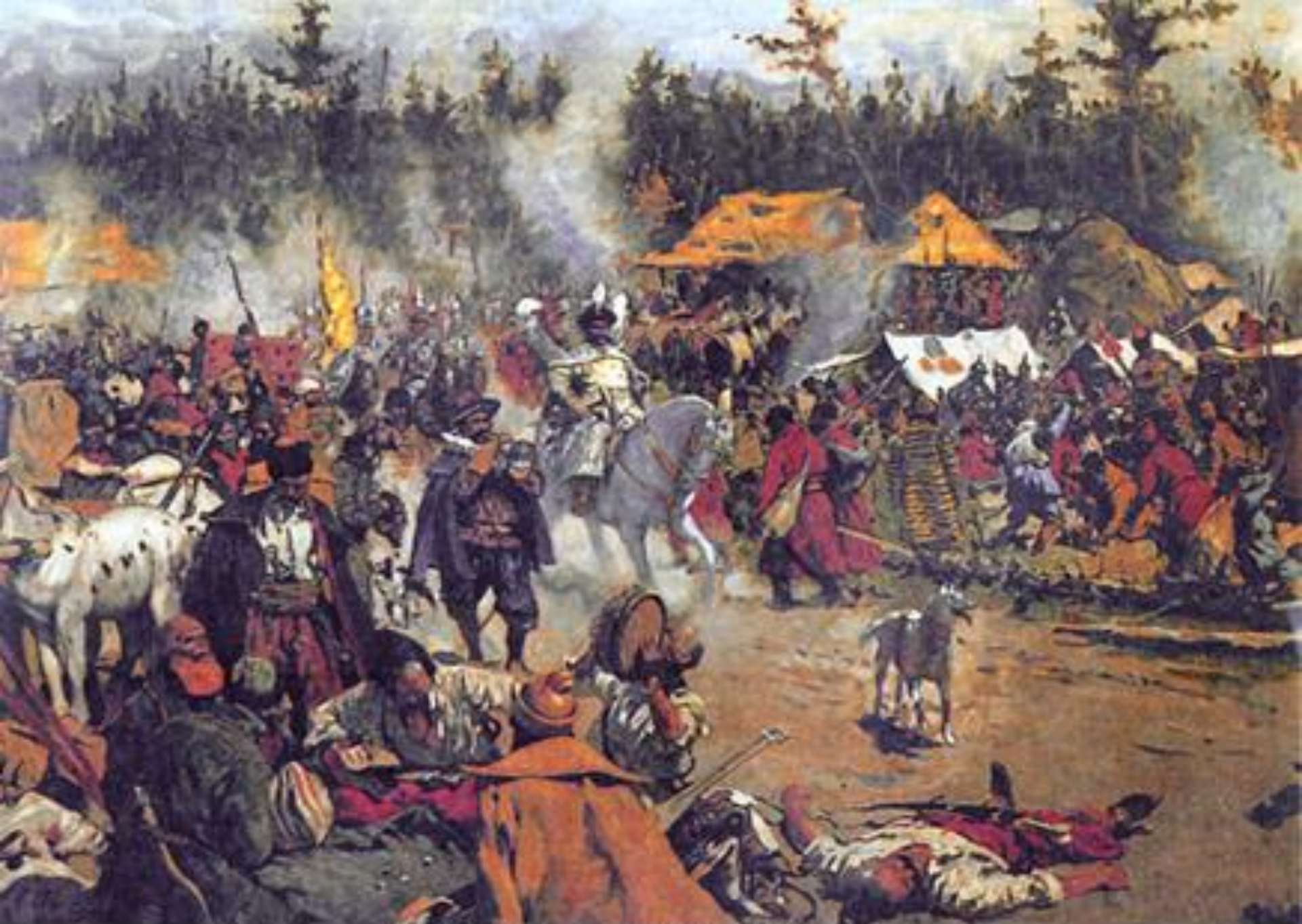
С.В. Иванов. "В смутное время"