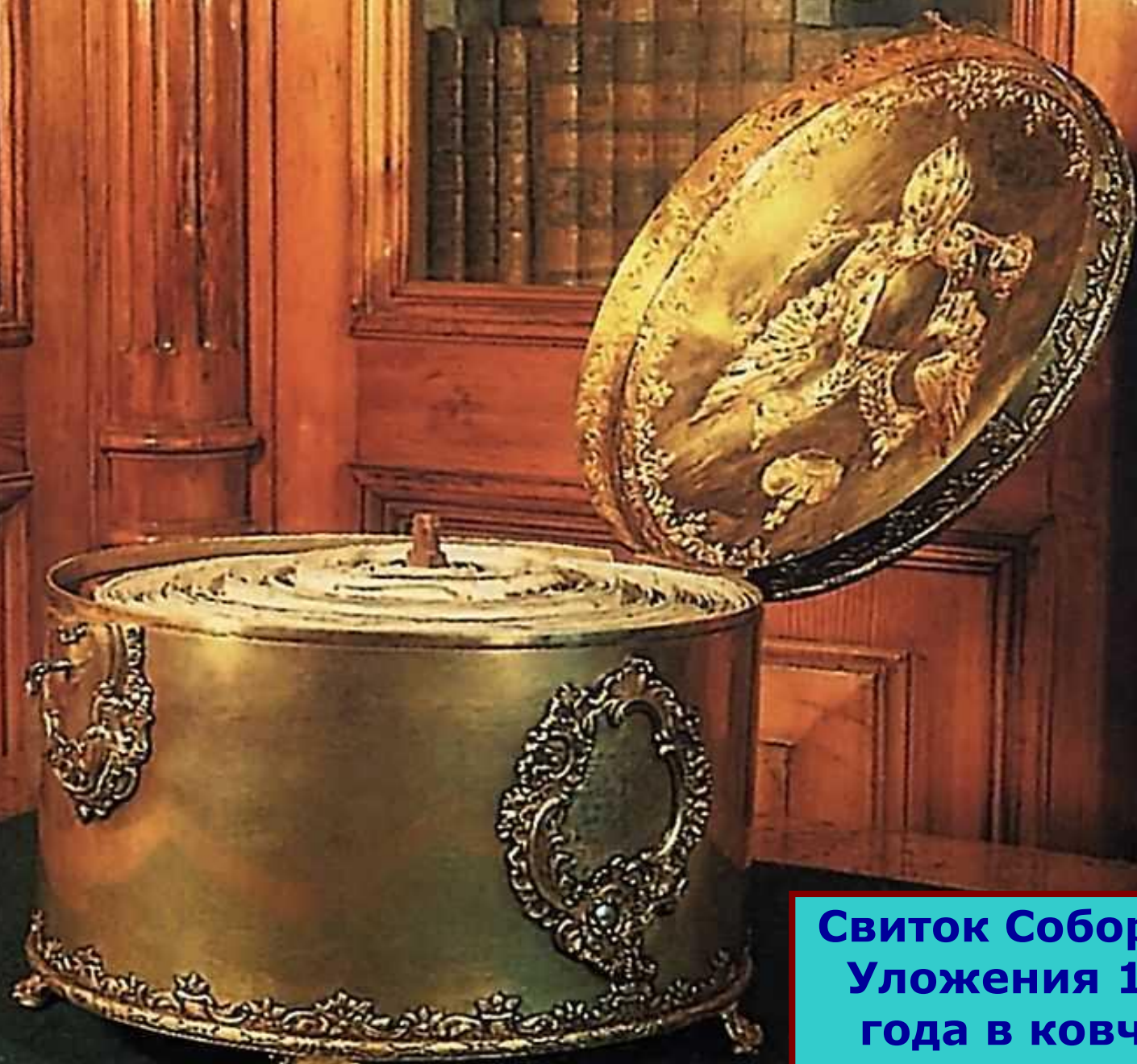
Свиток Соборного Уложения 1649 года в ковчеге