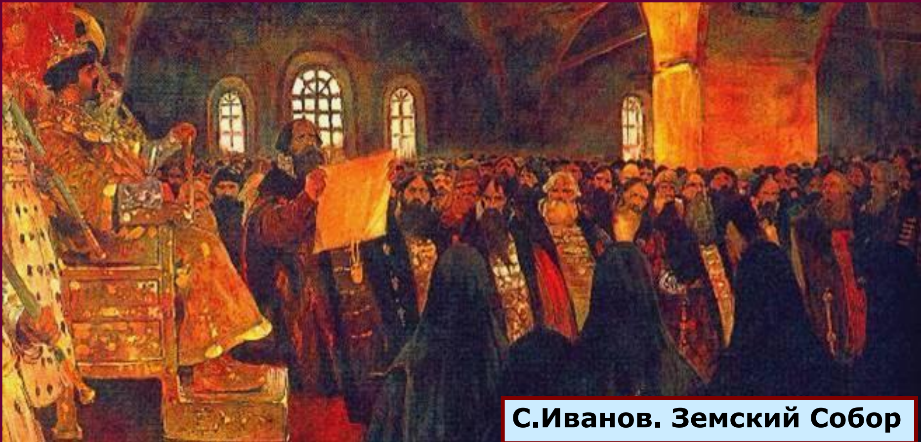
С.Иванов. Земский Собор

Собравшийся в 1648 г. Земский собор принял решение разработать новый свод законов вместо устаревшего "Судебника" XVI в., а также противоречивших друг другу законов и указов периода Смуты и послесмутного времени. Состоявшее из 25 глав Уложение было принято в январе 1649 г. Земским собором и действовало более 200 лет.