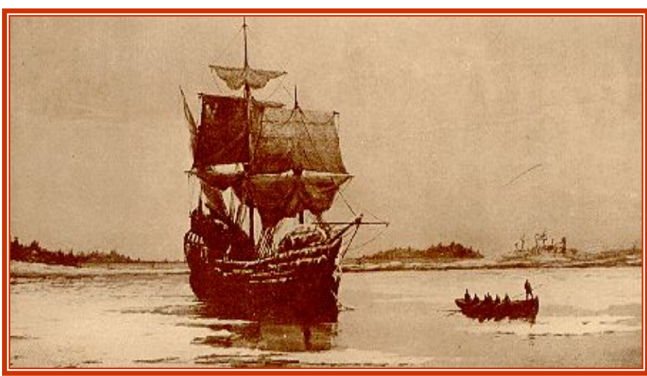
Прибытие колонистов на корабле “MAYFLOWER” в 1620 году в Плимутскую гавань