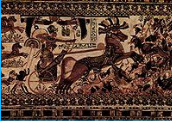
Тутанхамон на колеснице. Изображение из гробницы в Долине царей