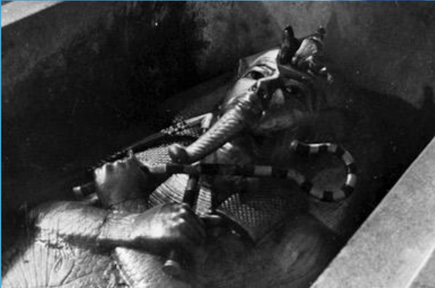
Первая фотография саркофага Тутанхамона