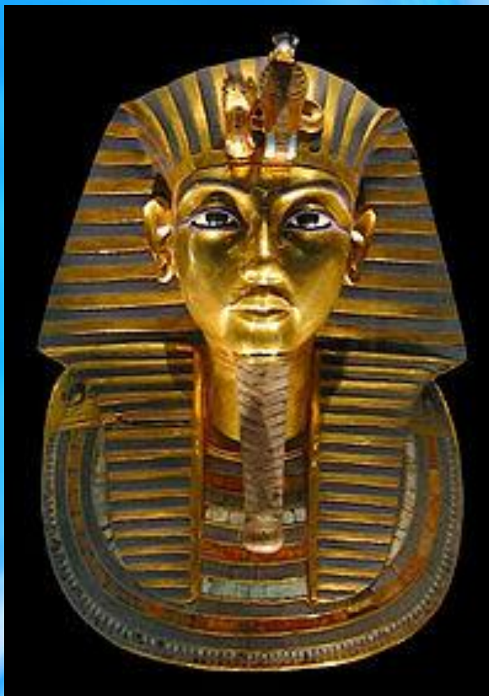
Посмертная маска Тутанхамона, символ Древнего Египта для Западной культуры. Каир, Египетский музей