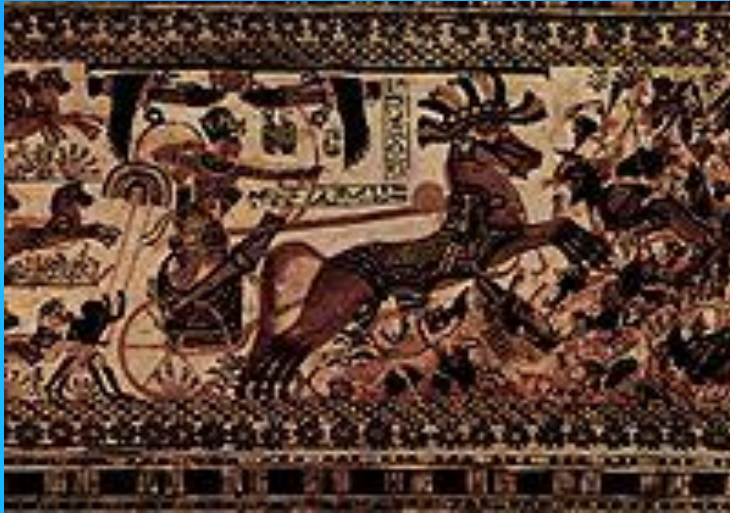
Тутанхамон на колеснице. Изображение из гробницы в Долине царей