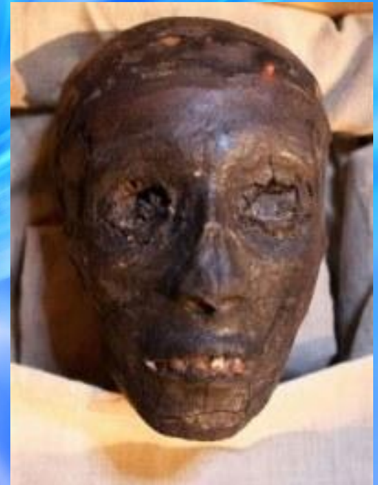
Голова мумии Тутанхамона, находящаяся в гробнице KV62 в Долине царей, Луксор