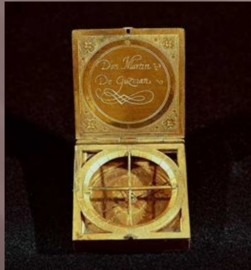
Портативные солнечные часы (Испания, 16в.)