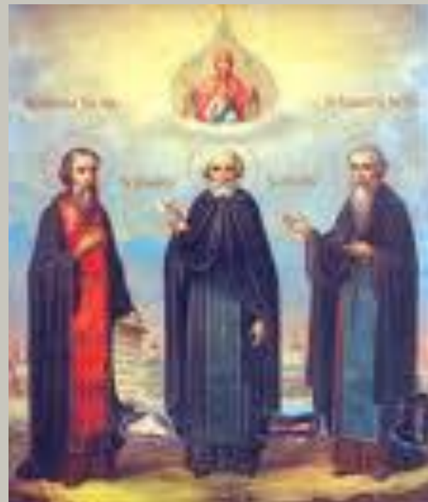
Преподобные Зосима, Савватий, Герман – Соловецкие чудотворцы

19-21 августа 1992 г. мощи преподобных Зосимы, Савватия и Германа, Соловецких чудотворцев, были перенесены из Петербурга в обитель. Торжества возглавлял Патриарх Алексий II; 22 августа (по н. ст.) стало праздноваться как Собор Соловецких святых.