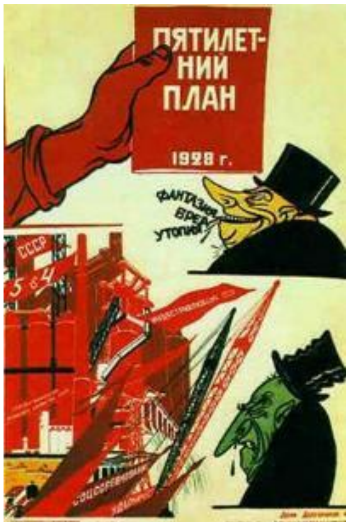
В.Дени, Н.Долгоруков. Первый пятилетний план.