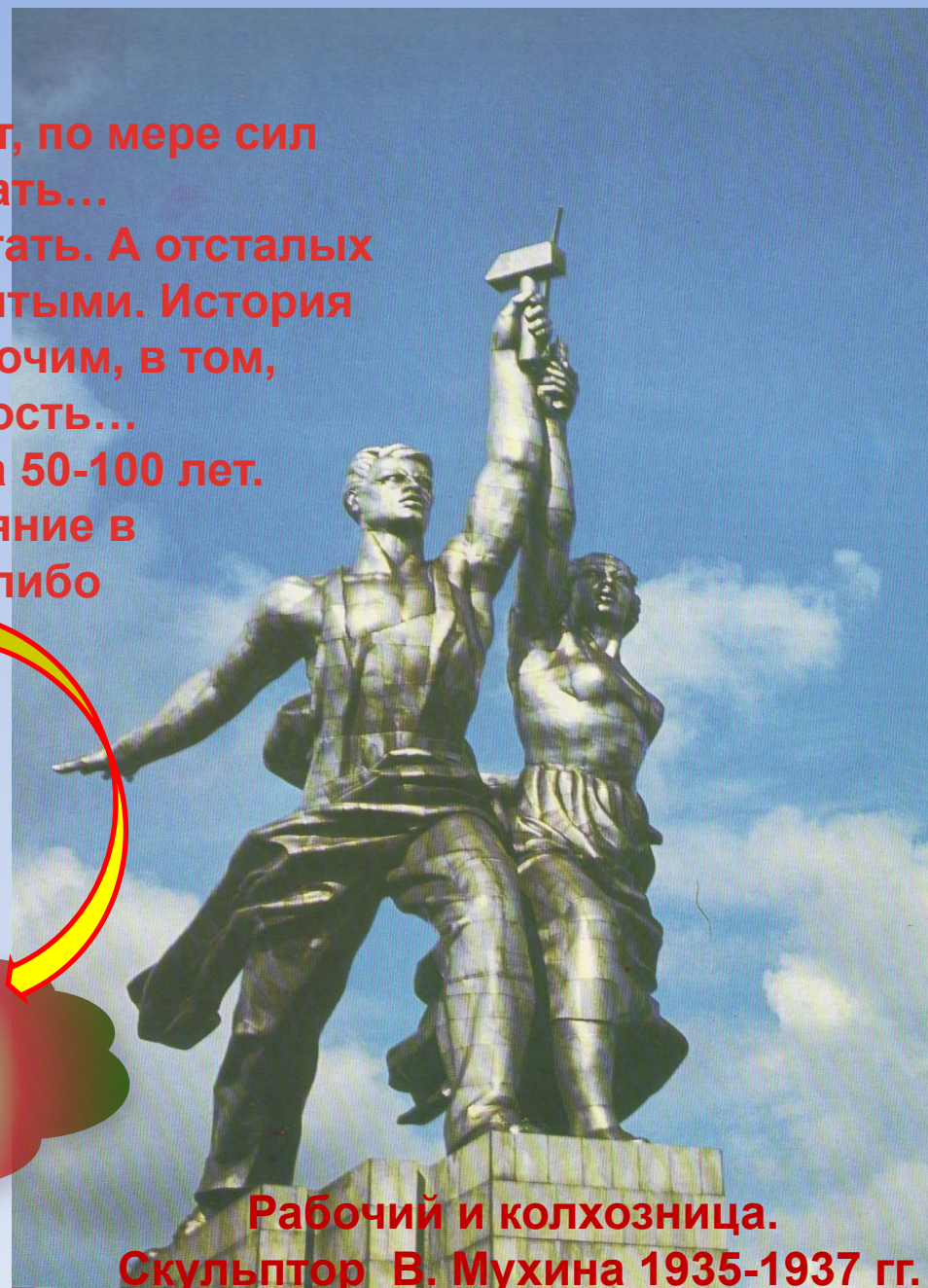
Рабочий и колхозница. Скульптор В. Мухоморова 1935-1937 гг.