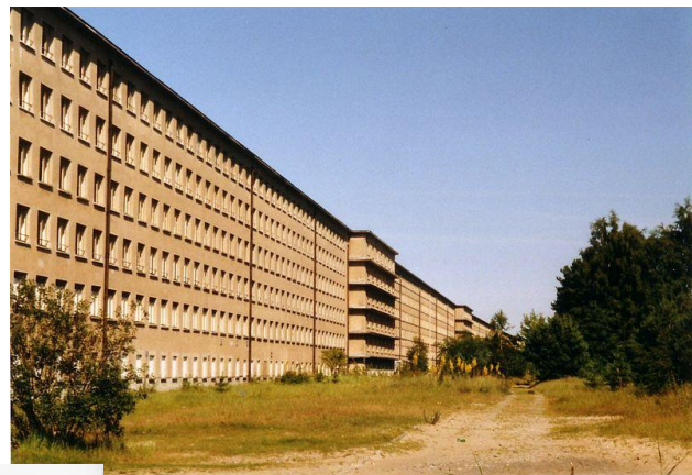
Дом отдыха “Прорский колосс”