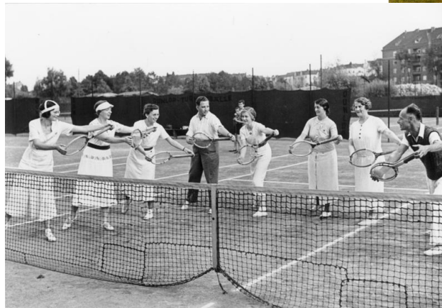
Спортивные мероприятия KdF