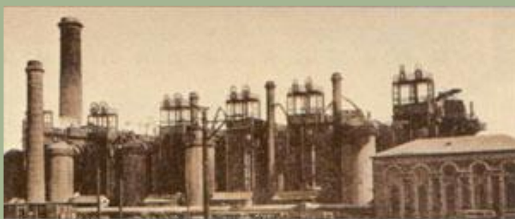
Завод Новороссийского общества каменноугольного, железоделательного и рельсового производств в Юзовке

К строительству железных дорог с помощью льгот и премий привлекали частных лиц и иностранный капитал (концессии). Особенно поощрялось строительство дорог, связанных с военными нуждами.