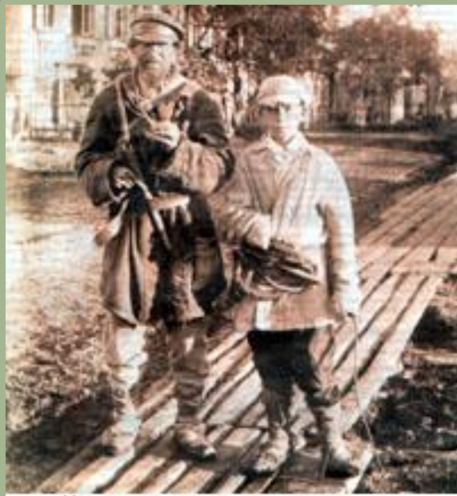
Крестьяне в городе. Конец XIX-начало XX вв.

С 1865 по 1879г. количество рабочих в промышленности выросло в полтора раза и достигло 1 млн человек. В основном пополнение шло за счет крестьян, уехавших в город на заработки и оставшихся в городе.