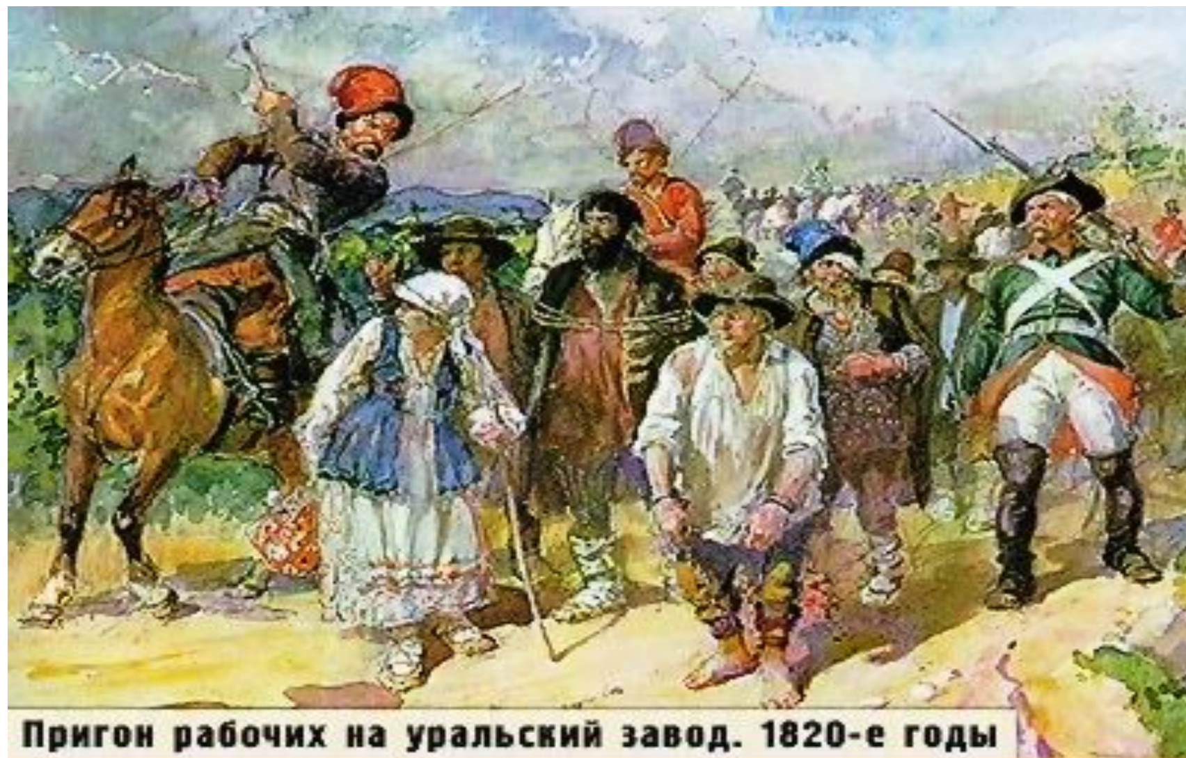
Пригон рабочих на уральский завод. 1820-е годы