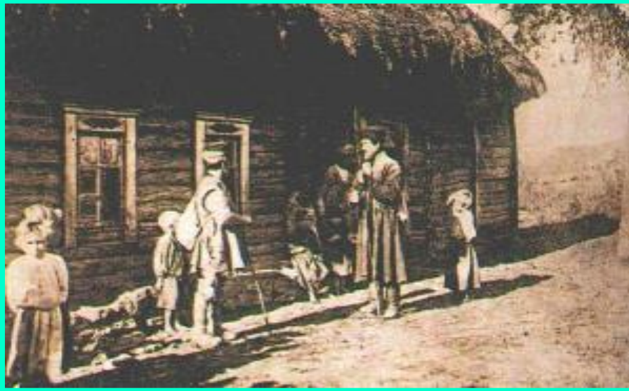
Крестьянский дом. (фото 19 века.)