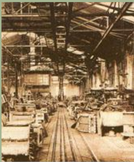
Паровозомеханическая мастерская Коломенского машиностроительного завода

Железнодорожное строительство Железные дороги России были необходимы: ?