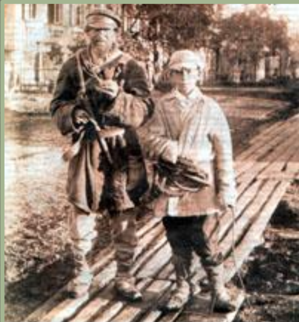
Крестьяне в городе. Конец XIX-начало XX вв.