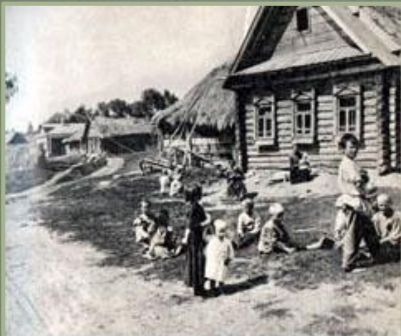
Калужская деревня. Конец XIX-начало XX вв.

Основой сельского хозяйства после реформы оставались помещичьи и крестьянские хозяйства. В первые годы после реформы в сельском хозяйстве происходил спад производства. Почему?