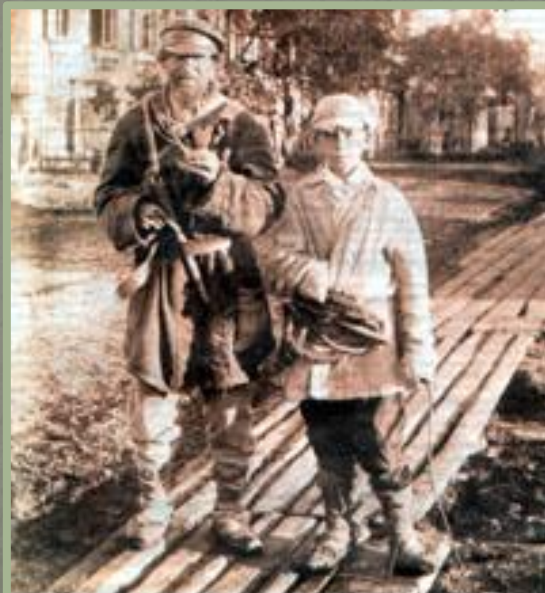
Крестьяне в городе. Конец XIX-начало XX вв.

Основой сельского хозяйства после реформы оставались помещичьи и крестьянские хозяйства. В первые годы после реформы в сельском хозяйстве происходил спад производства. Почему?