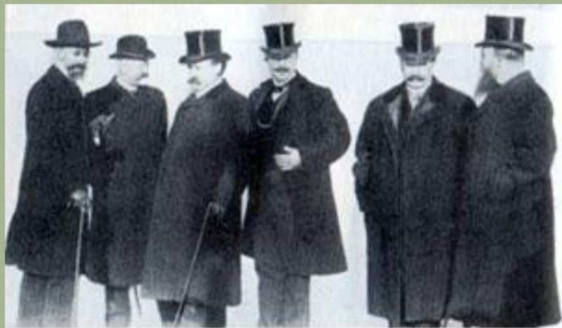
Представители московского делового мира