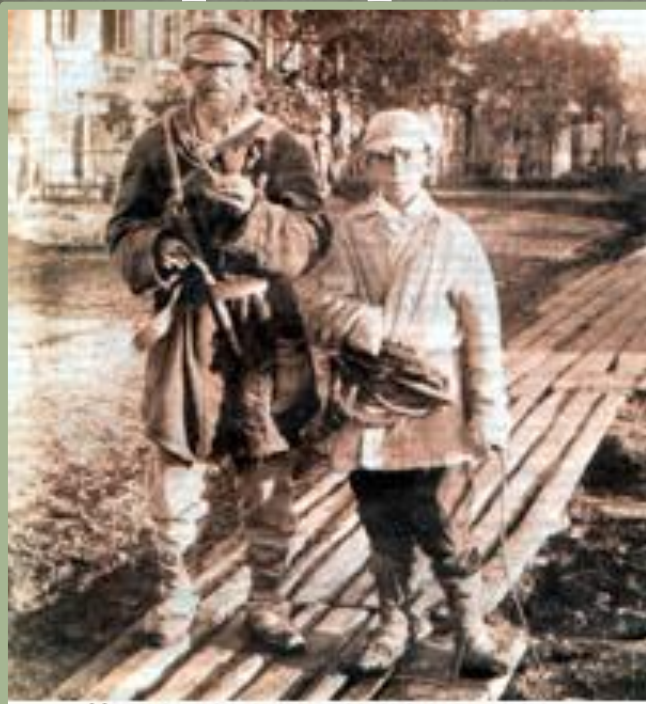
Крестьяне в городе. Конец XIX-начало XX вв.

С 1865 по 1879г. количество рабочих в промышленности выросло в полтора раза и достигло 1 млн человек. В основном пополнение шло за счет крестьян, уехавших в город на заработки и оставшихся в городе.