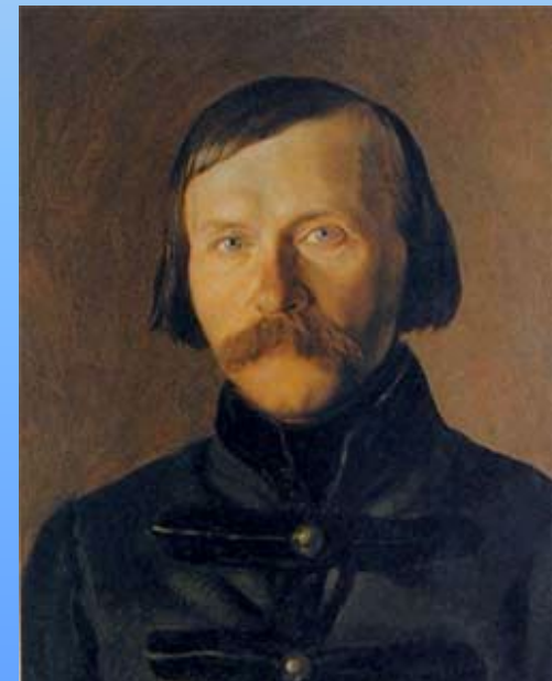
П. В. Киреевский