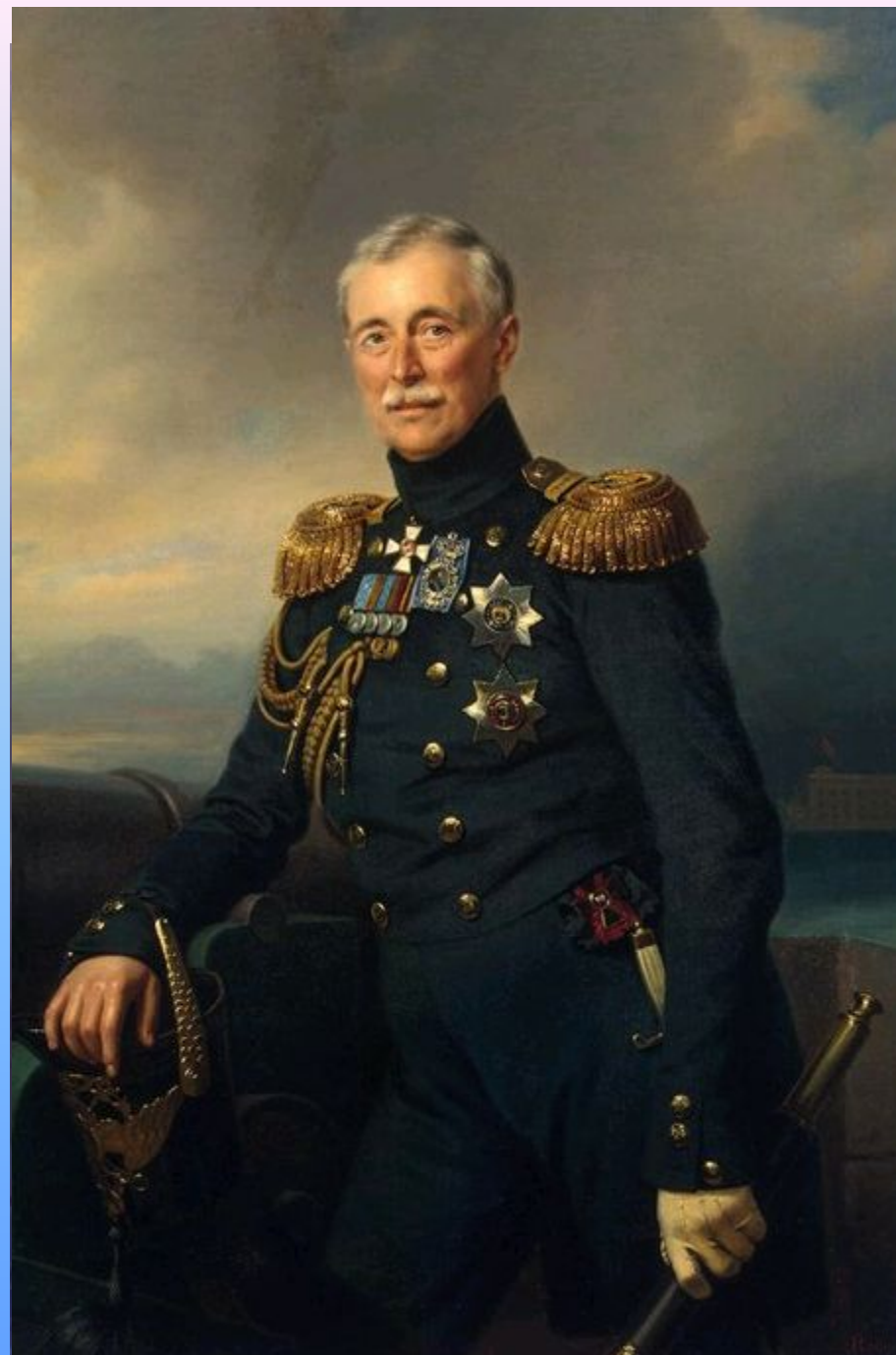
А. Ф. Орлов

Политика Николая I была противоречивой и двойственной : с одной стороны, широкая политическая реакция, с другой - осознание необходимости уступок "духу времени".