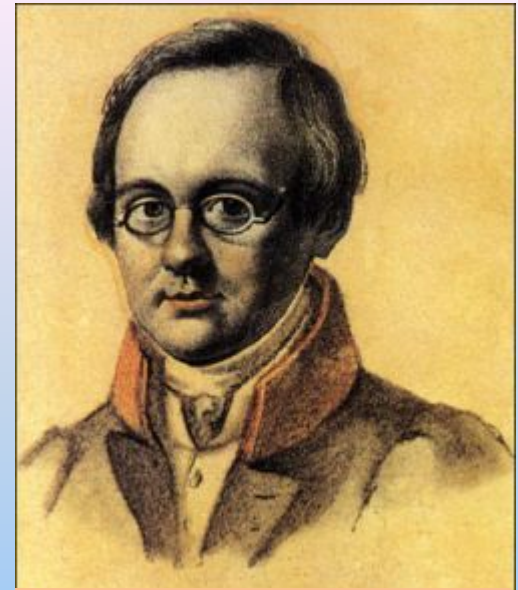
А. А. Дельвиг

Об открытии же новых изданий не идет и речи. Так, на ходатайство "западника" Т. Н. Грановского о разрешении журнала "Московское обозрение" летом 1844 года Николай I ответил коротко и ясно: "И без нового довольно".