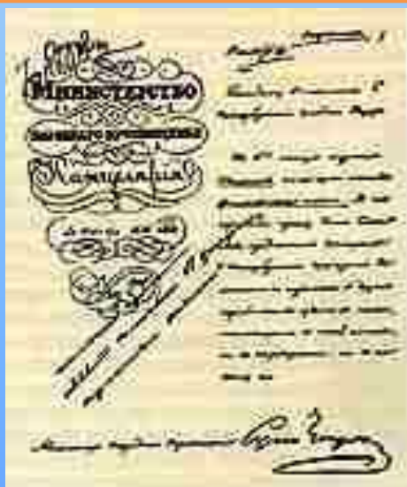
Предписание министра просвещения С.С. Уварова запрещающее публиковать печатные отзывы на первое "Философское письмо"

А теория «официальной народности» на многие десятилетия стала главной идеологией самодержавия.