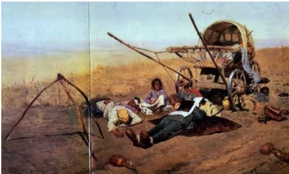
«В дороге...смерть переселенца»