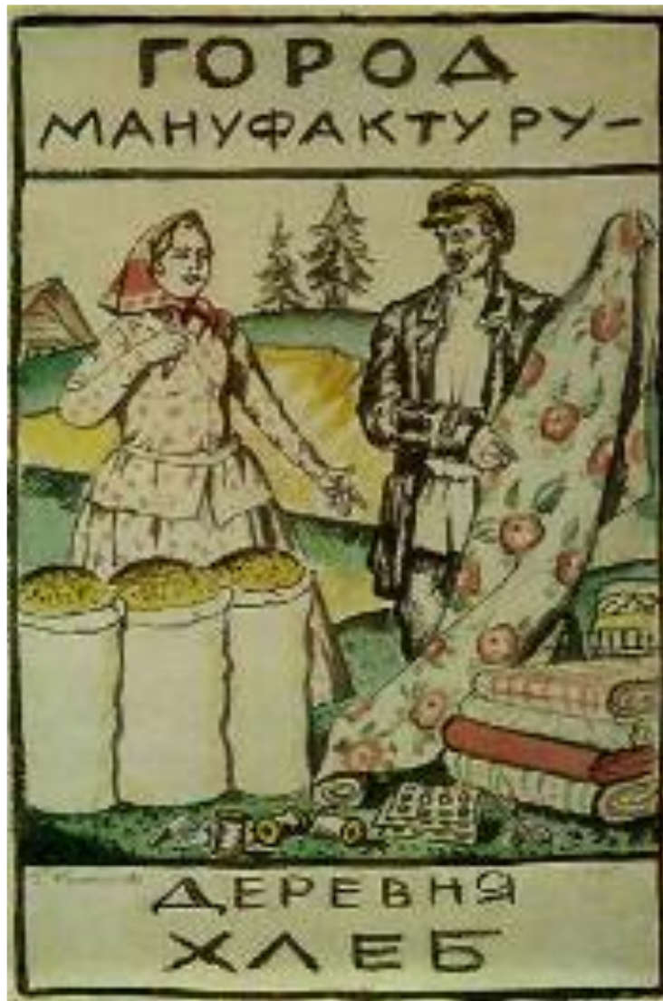
Плакат 1925 г.

Госсектор был малопродуктивным. Нэпманы держали накопления в тайниках, опасаясь их повторного изъятия. Средняцкие хозяйства в деревне не могли поставлять большое количество товарного хлеба для продажи его за границу. Это привело к сокращению закупок иностранной техники почти в двое, а собственное производство было малоразвито. Все это привело к замедлению темпов экономического роста во 2-й пол. 20-х гг.