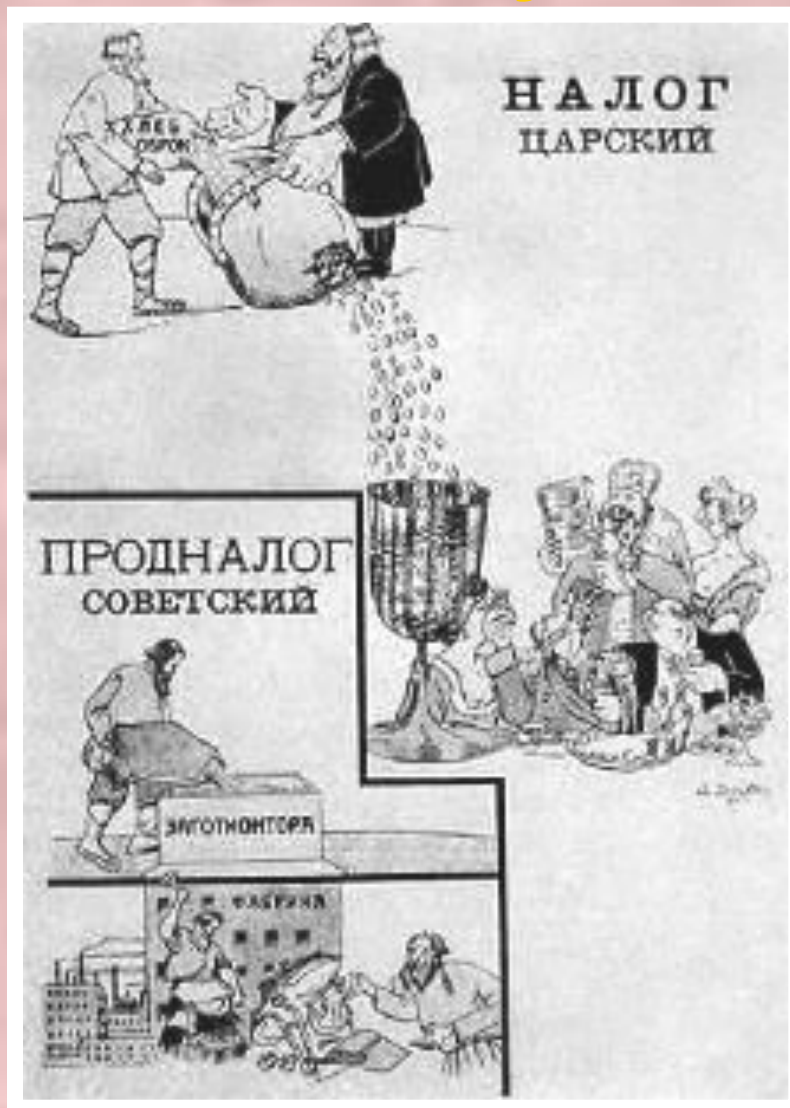
Плакат 1921 г.

Это потребовало отмены принудительного труда, введения тарифной системы зарплаты, формирования рынка труда. Была проведена денежная реформа - восстанавливалось денежное обращение. Был выпущен «золотой червонец». В то же время крупные предприятия остались в руках государства. В 1923 г. были созданы тресты и синдикаты, работавшие на самоокупаемости. Ленин считал, что НЭП вводится «всерьез и надолго».