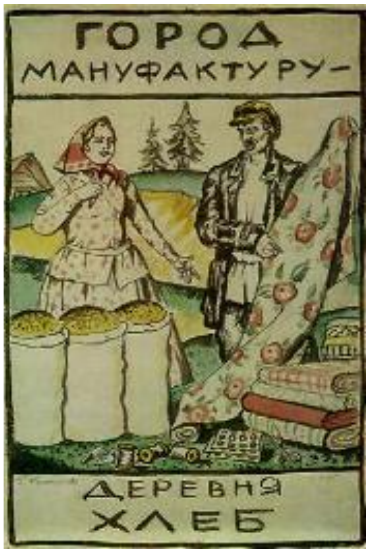
Плакат 1925 г.

Сектор был малопродуктивным. Нэпманы держали накопления в тайниках, опасаясь их повторного изъятия. Средняцкие хозяйства в деревне не могли поставлять большое количество товарного хлеба для продажи его за границу. Это привело к сокращению закупок иностранной техники почти в двое, а собственное производство было малоразвито. Все это привело к замедлению темпов экономического роста во 2-й пол. 20-х гг.