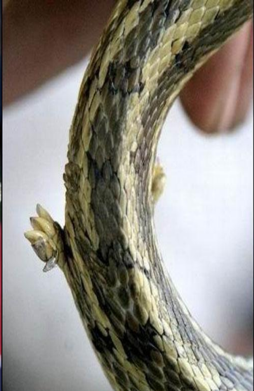
Змея поймана в Китае 2011 год