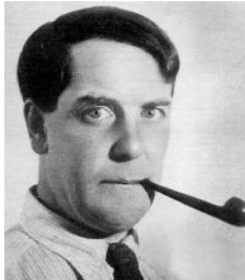
А.Иоффе и П.Капица

Несмотря на идеологическое давление представители естественных наук смогли добиться выдающихся успехов. С.Вавилов(оптика), А.Иоффе(физика кристаллов),П.Капица(микрофизика),И.Курчатов(ядерная физика) и др. обогатили мировую науку. Химики Н.Зелинский, А.Бах,С.Лебедев сделали фундаментальные открытия в области получения искусственных веществ и органических пищевых про-