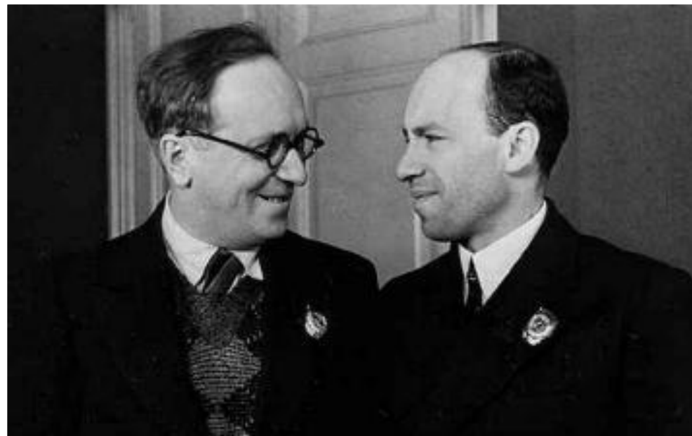
И. Дунаевский и В. Лебедев-Кумач.

Развитие музыки было связано с именами С. Прокофьева, Д. Шостаковича, Т. Хренникова, И. Дунаевского. Появились музыкальные коллективы - Большой симфонический оркестр, квартет им. Бетховена и т. д. При оценке творчества композиторов огромную роль играли вкусы вождей, поэтому жесткой критике подвергся Д. Шостакович. Своего расцвета достигло песенное творчество. Произведения И. Дунаевского, Б. Мокроусова, М. Блантера, братьев Покрасс знала вся страна.