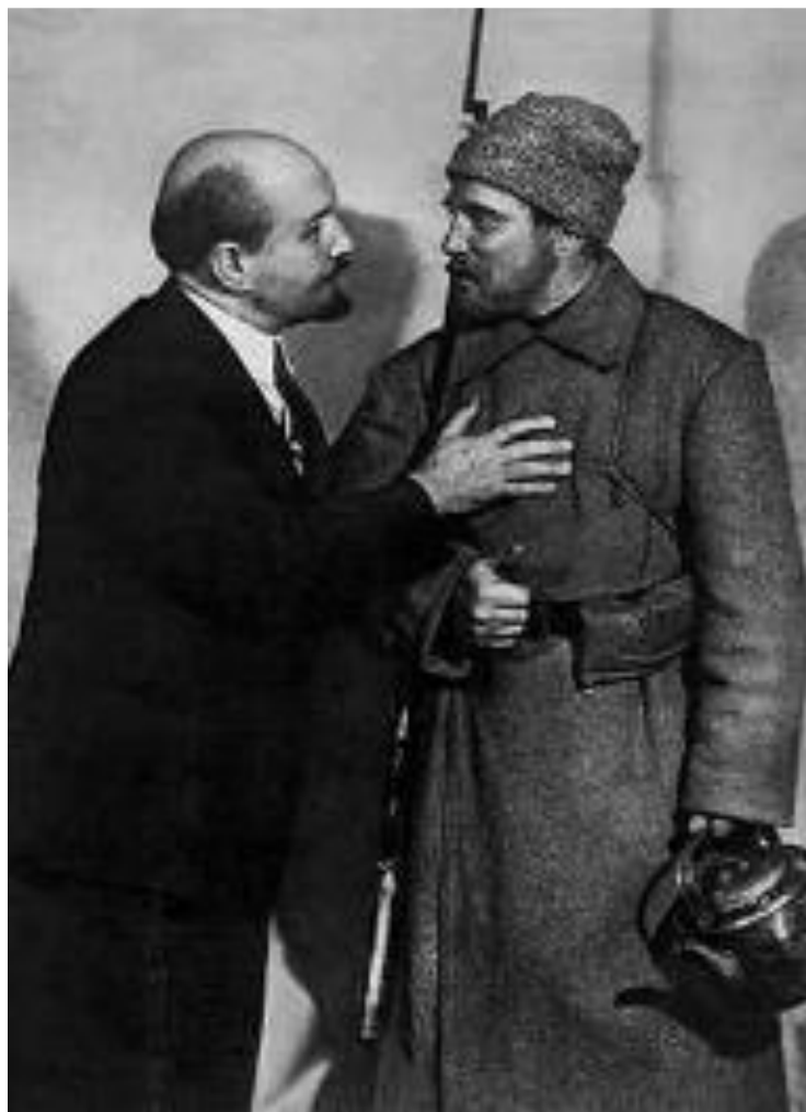
Б.Щукин в роли Ленина В спектакле «Человек с ружьем»

В к. 20-х гг. на сценах советских театров начинают утверждаться пьесы советских драматургов. «Человек с ружьем» Н.Погодина, «Оптимистическая трагедия» В.Вишневского, «Таня» А.Арбузова – составили «золотой фонд» репертуара многих театров.