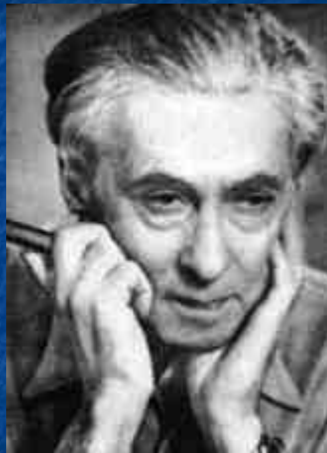
Илья Эренбург (1891-1967) писатель, публицист