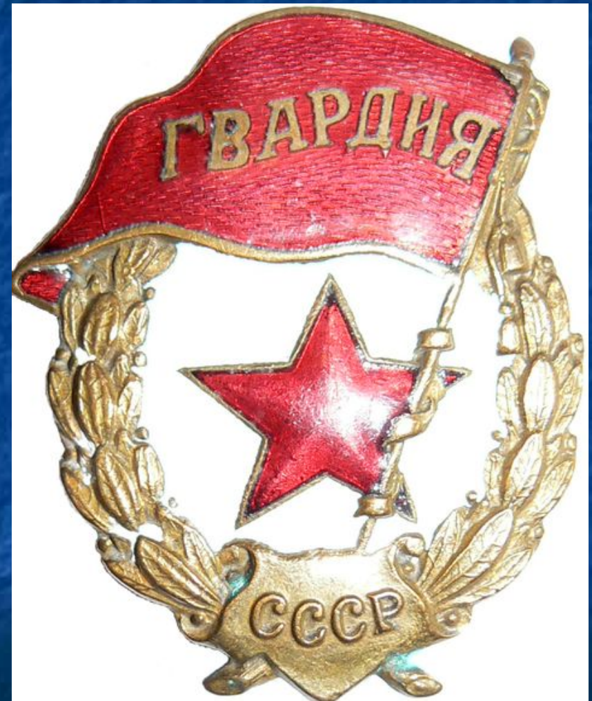
■ Нагрудный знак гвардейца. 1942 г.